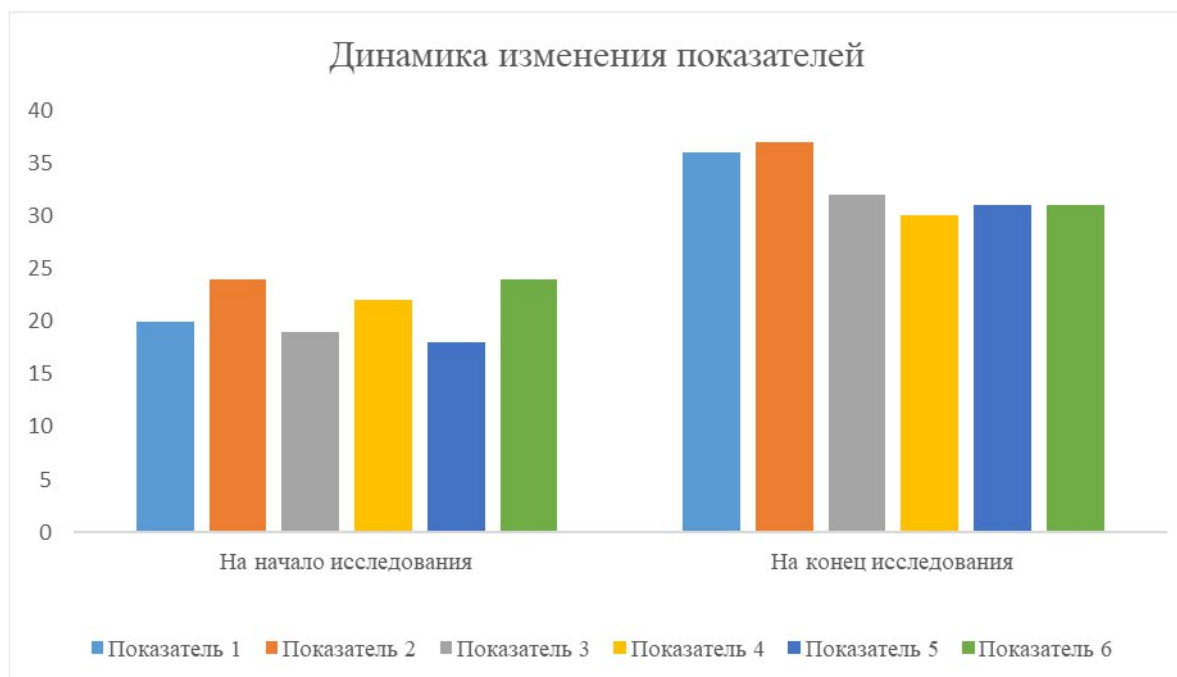
Рисунок 1 – Показатели сформированности у младших школьников отношения к милосердию как ценности по всем показателям

На рисунке 1 можем увидеть сравнительные результаты по первому критерию «понимание обучающимися милосердия как ценности, выражение устойчивого мнения о милосердии (когнитивный)» на начало и на конец исследовательской работы. Уровень первого показателя – «наличие у ребёнка полного представления о милосердии как о нравственном понятии, знание его характеристик», увеличился на 44 %; уровень второго показателя – «понимание необходимости быть милосердным для самоуважения и достойной жизни в обществе» на 35 %. Гистограмма также наглядно отражает разницу в показателях второго критерия – «осознанность понимания милосердия как ценности (мотивационный или эмоциональный)». Уровень третьего показателя – «умение целенаправленно выражать свои чувства в ответ на различные внутренние состояния других людей», увеличился на 41 %; уровень четвертого показателя – «осознаёт чужие эмоции и откликается на них», увеличился на 27 %. Результаты по третьему критерию – «готовность проявлять милосердие, брать за основу своего поведения (поведенческий или