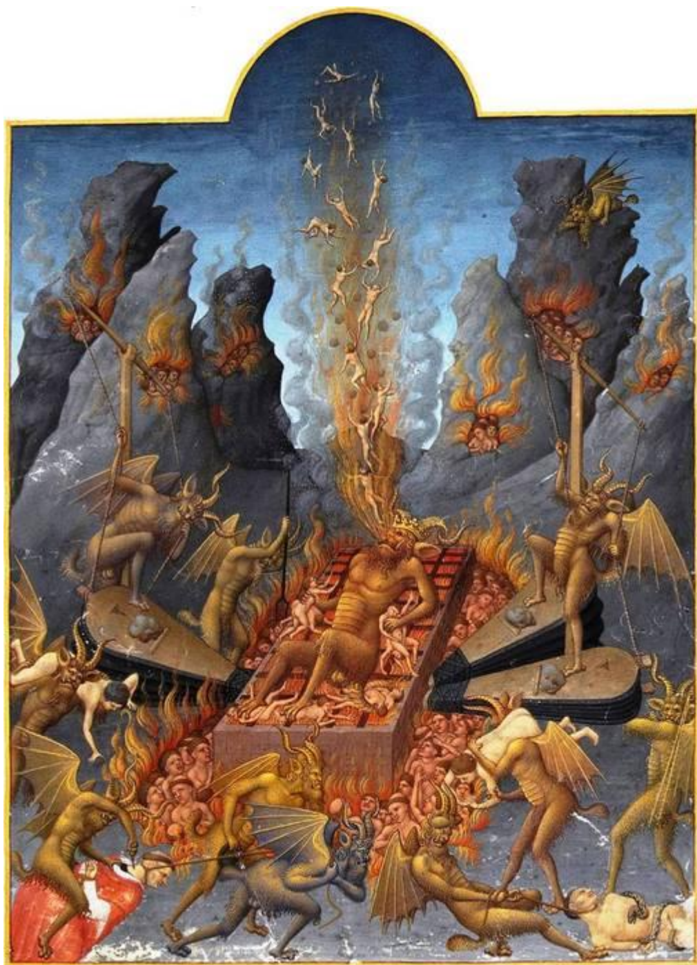
Сатана в аду. Иллюстрация из «Великолепного часослова»