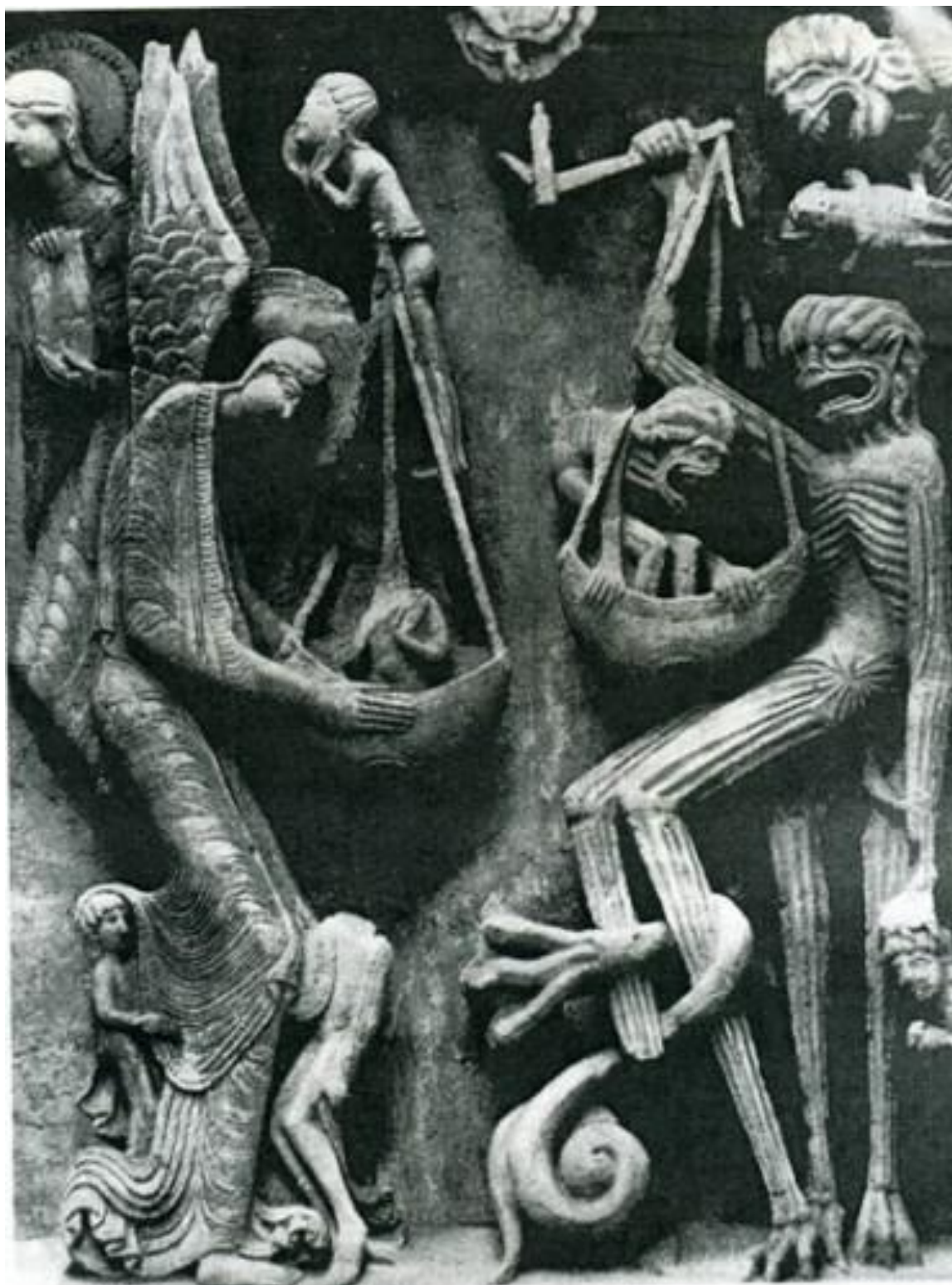
Фрагмент правой части композиции Страшного суда