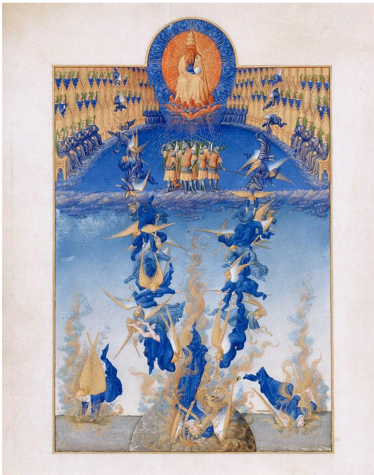
«Падение ангелов», иллюстрация из «Великолепного часослова»