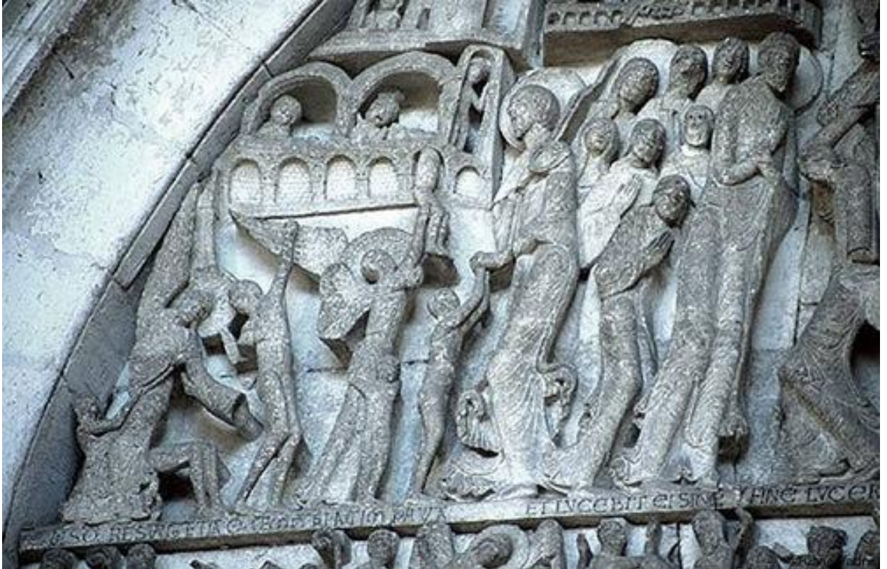
Фрагмент левой части композиции Страшного суда