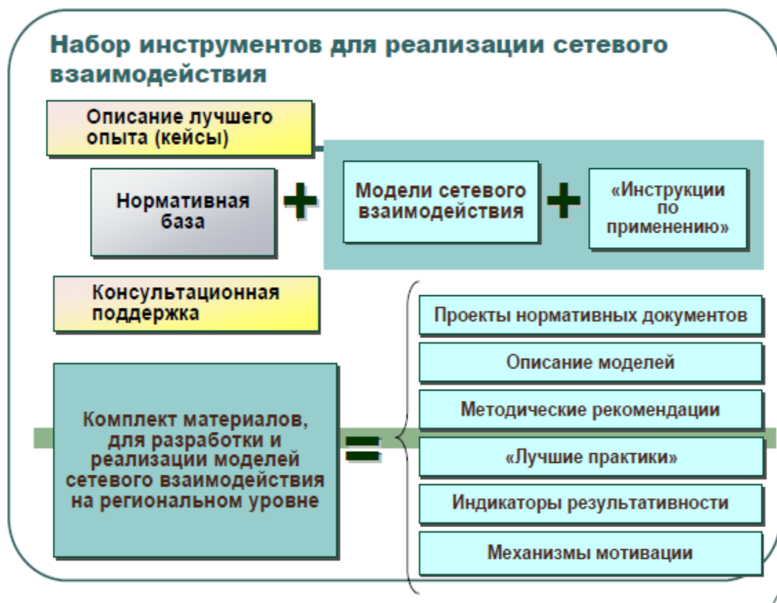
Рисунок 1. Инструменты для реализации сетевого взаимоотношения

Опыт ряда регионов, участвующих в эксперименте по профессиональному обучению, показывает, что в институтах повышения квалификации, педагогических вузах, в колледжах на местах создаются собственные схемы сетевого взаимоотношения образовательных организаций и организаций. Многие из них представляют интерес и заслуживают поддержки. В этой связи можно рекомендовать региональным и муниципальным органам управления образованием организовывать обмен и распространение опыта сетевого взаимоотношения образовательных организаций и организаций с целью всеобщего постепенного (с учётом готовности каждой конкретной территории) перехода от несетевых к сетевым формам ПО. Это направление работы можно рассматривать как основной и наиболее перспективный вектор дальнейшего развития общероссийской системы ПО на старшей ступени общего образования [21].