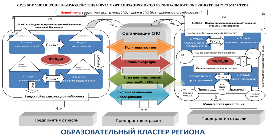
Рисунок 4. Модель сетевого управления взаимодействием ВУЗа с организациями СПО регионального образовательного кластера

Сеть помогает найти прецеденты, получить экспертизу собственных разработок, расширить перечень образовательных услуг для студентов, в том числе, посредством реализации образовательных программ в сетевой форме [56].