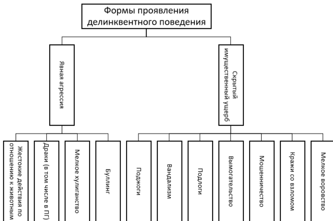
Рисунок 1 – Формы проявления делинквентного поведения

Как и у любого другого явления, делинквентное поведение имеет свои отличительные особенности [17].