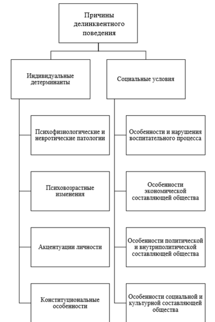
Рисунок 2 – Причины делинквентного поведения

В данной схеме отцентрованы две значимых группы факторов делинквентного поведения: