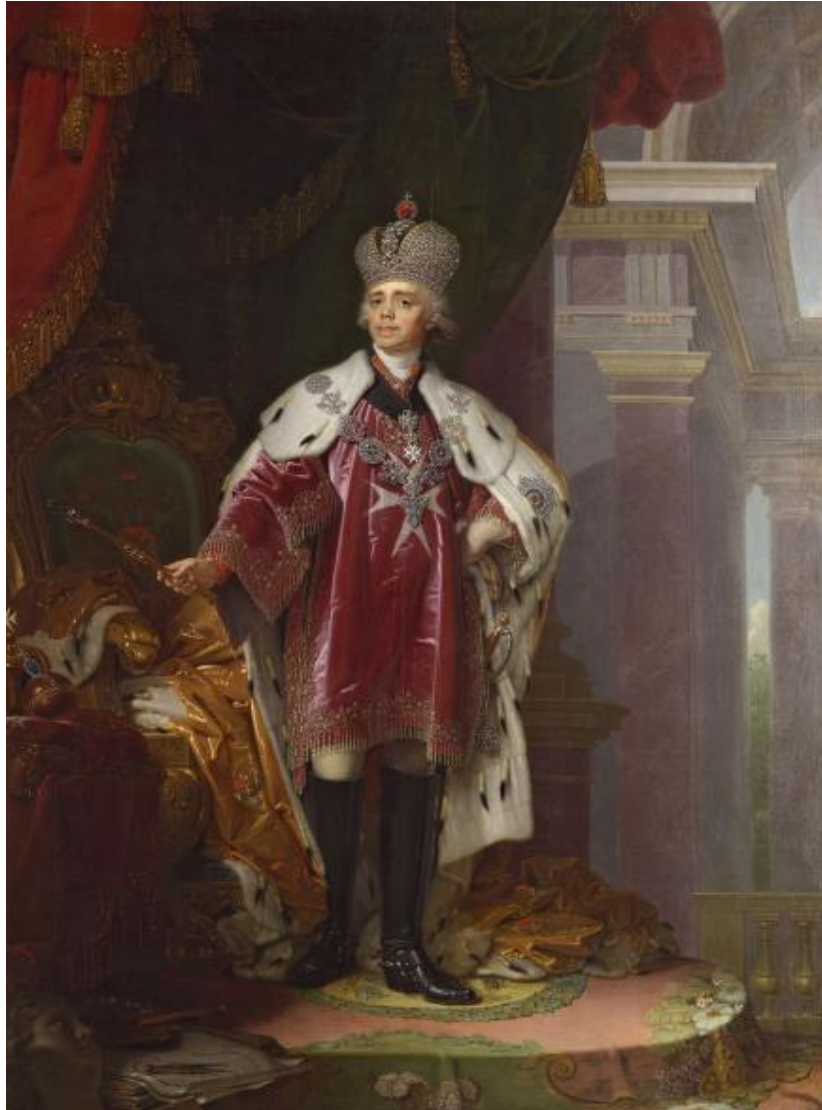
Фотография 1. Император Павел I (1754–1801) 67