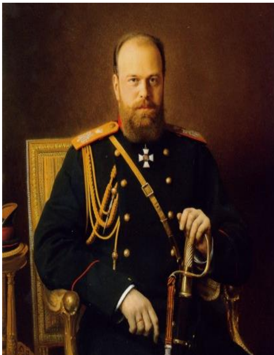
Фотография 5. Император Александр III (1845–1894) 71