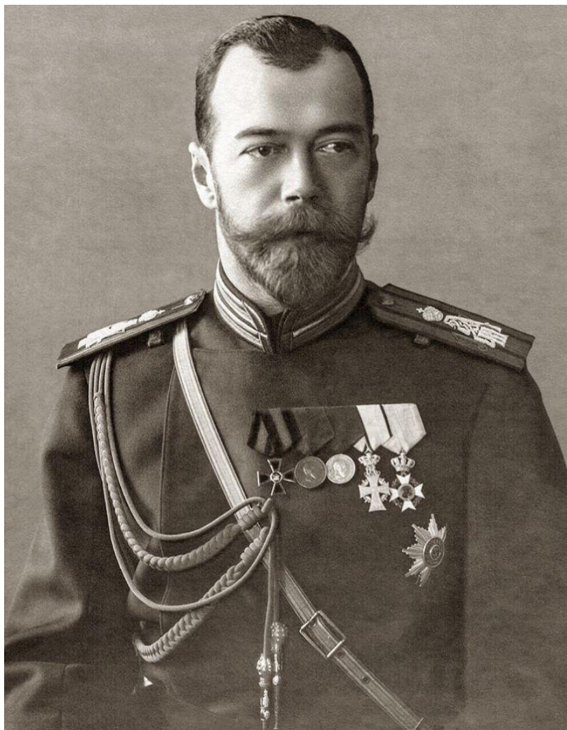
Фотография 6. Император Николай II (1868–1918) 72