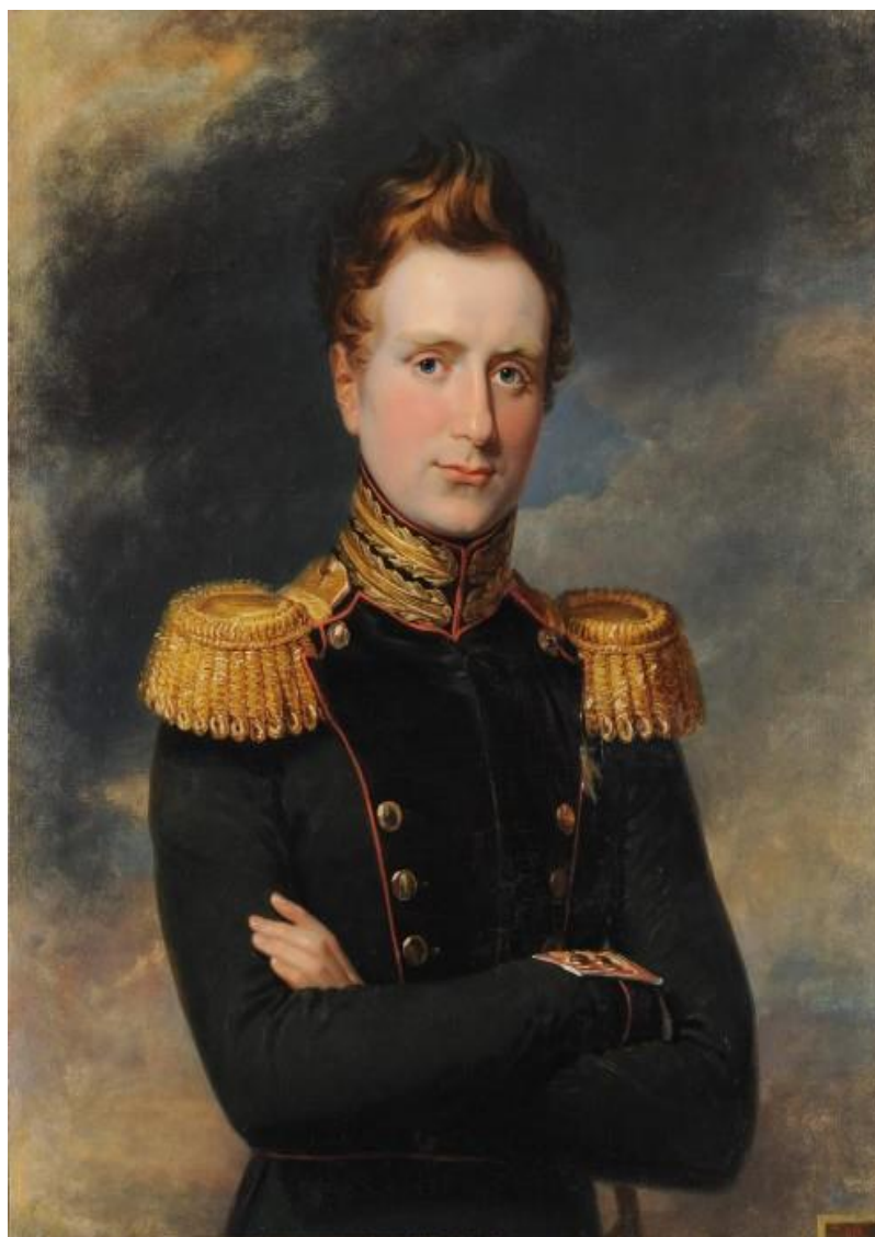
Фотография 10. Великий князь Михаил Павлович (1798–1849) 76