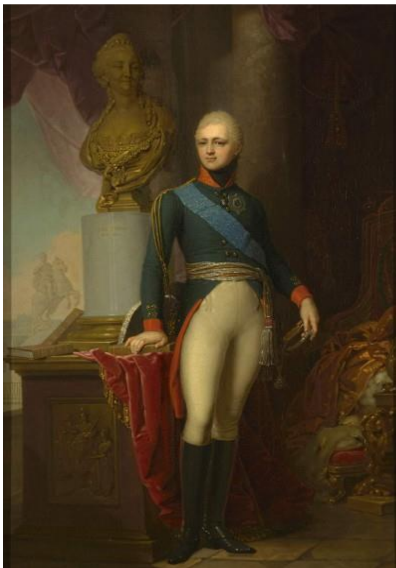
Фотография 3. Император Александр I (1777–1825) 69