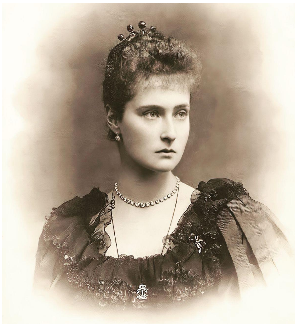
Фотография 7. Императрица Александра Федоровна (1872–1918) 73