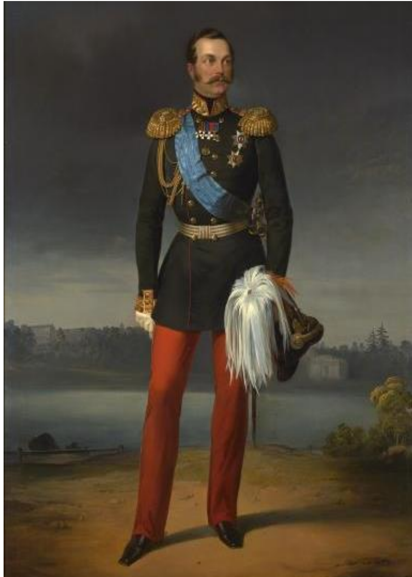
Фотография 4. Император Александр II (1818–1881) 70