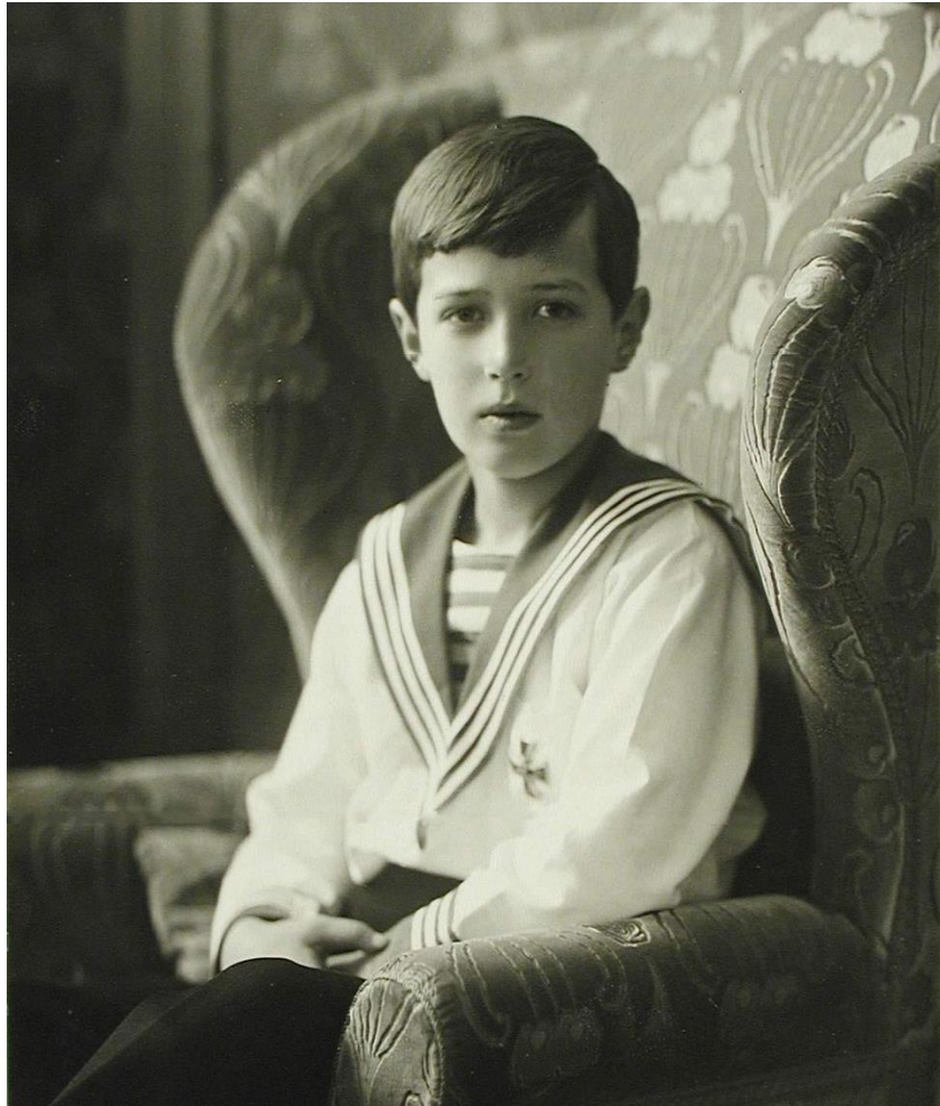
Фотография 8. Цесаревич Алексей – последний официальный наследник российского престола 74