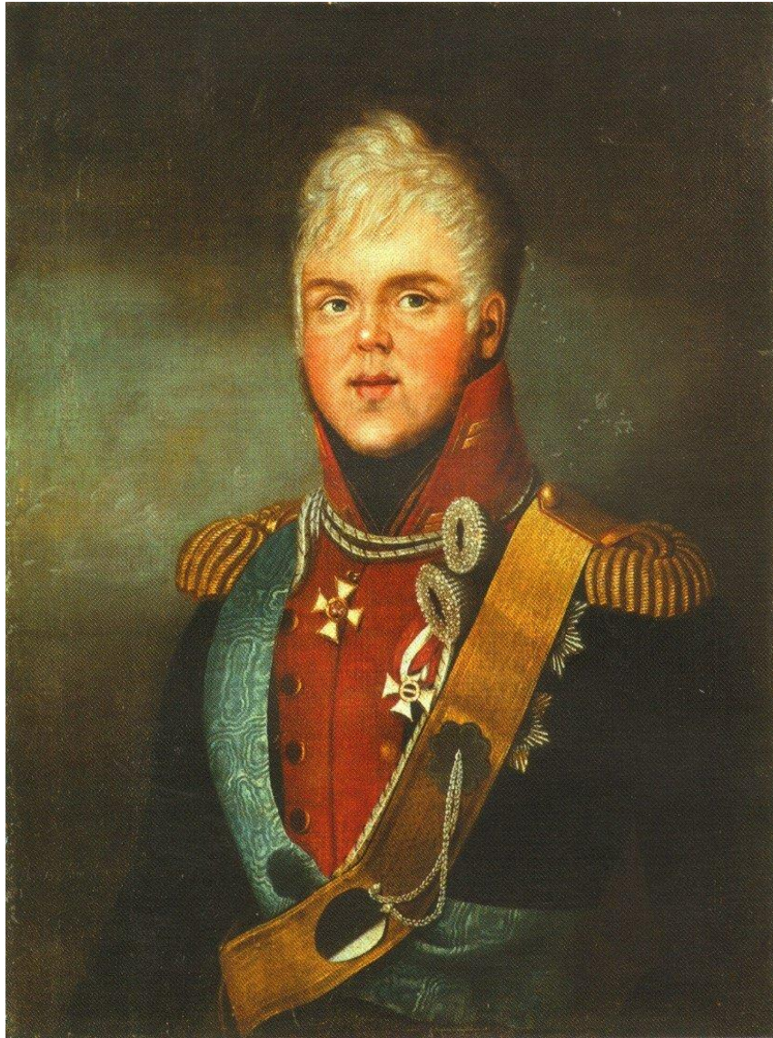
Фотография 2. Великий князь Константин Павлович (1779–1831) 68