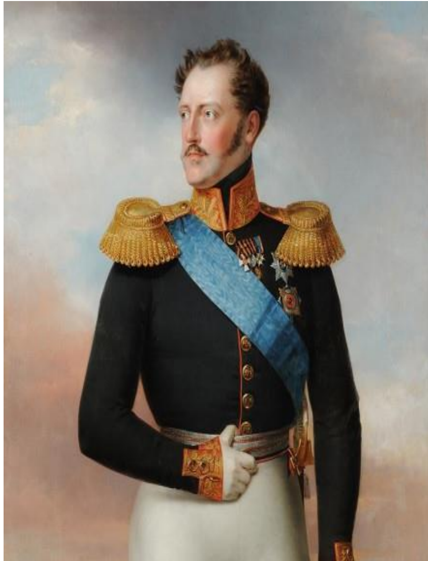
Фотография 9. Император Николай I (1796–1855) 75