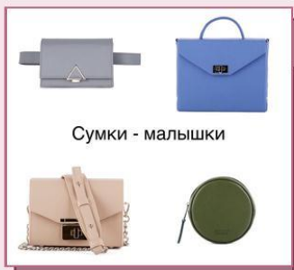
Сумки - малышки