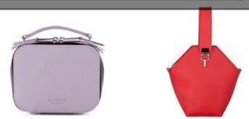
Сумки среднего размера