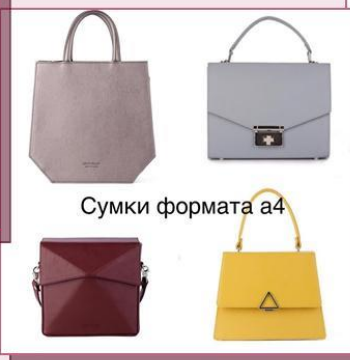
Сумки формата а4