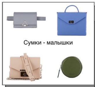
Сумки - малышки