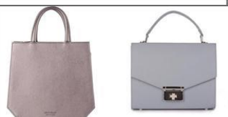
Сумки формата а4