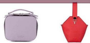
Сумки среднего размера