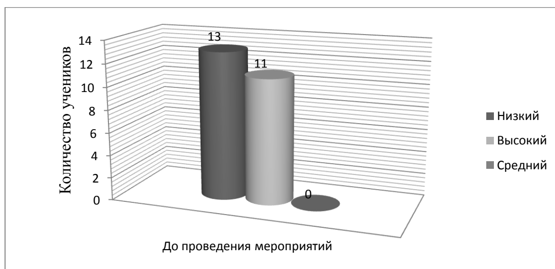
Рис. 2.2 – Уровень умения старшеклассников решать задачи с экономическим содержанием на констатирующем этапе