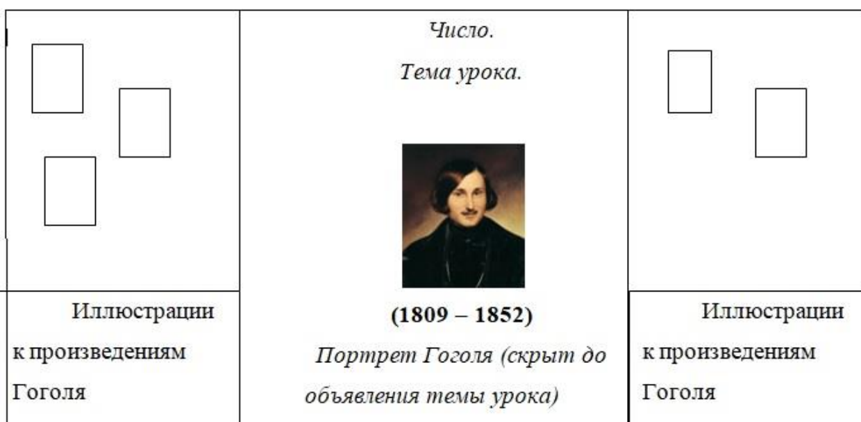
Рисунок 1 «Оформление доски»

Оборудование: мультимедиа, компьютер, слайды, портрет Н.В. Гоголя, иллюстрации к произведениям Гоголя: «Вечера на хуторе близ Диканьки», «Миргород», «Арабески», «Мёртвые души» «Выбранные места из переписки с друзьями», раздаточный материал (отрывок из письма Гоголя к матери), реквизит для сценки (учительский стол, стул, свиток со стихотворением, таблички с обозначением ролей)