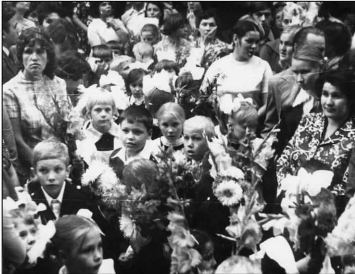
1 сентября в школе № 46 г. Челябинска. 1981 г.