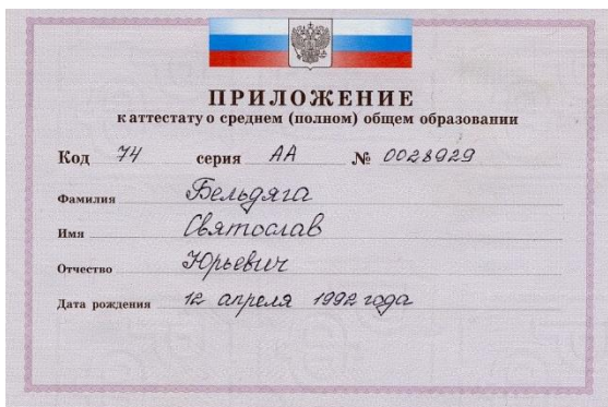
Документы об окончании Российской школы XXI в.