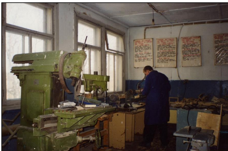
Серпиевская средняя школа. На уроке труда