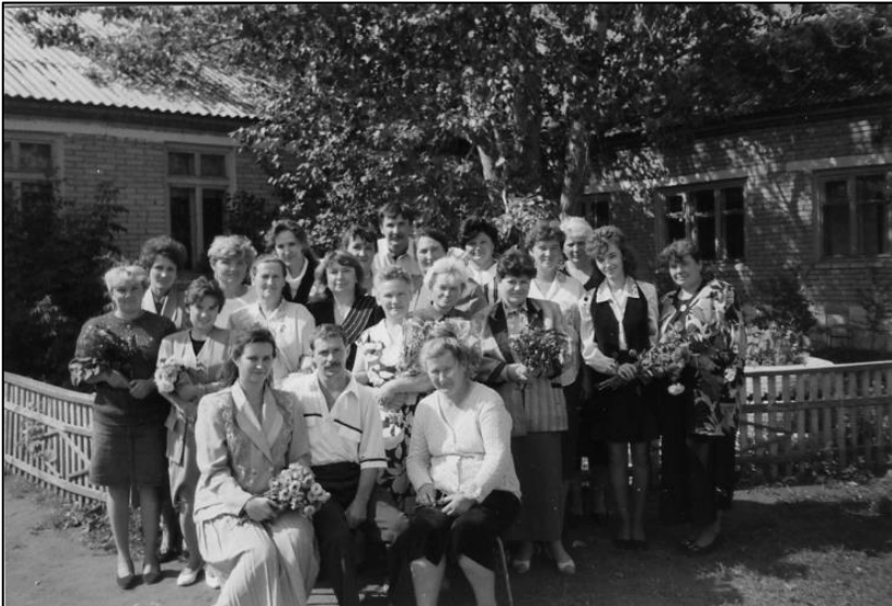
Коллектив Новомосковской школы. 90-е гг. XX в.