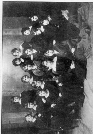
Челябинские пианистки. С фото нач. XX века