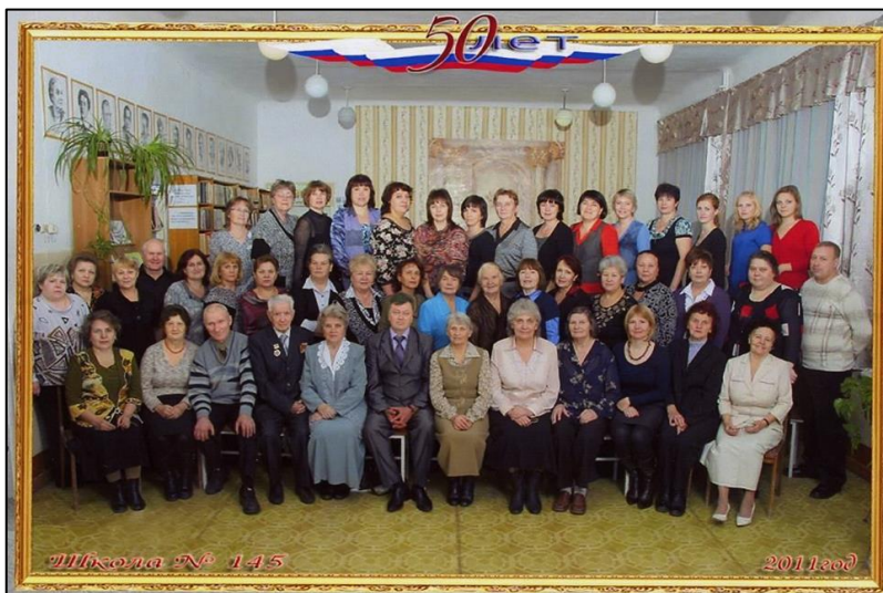
Педагогический коллектив МАОУ СОШ № 145 насчитывает 58 человек