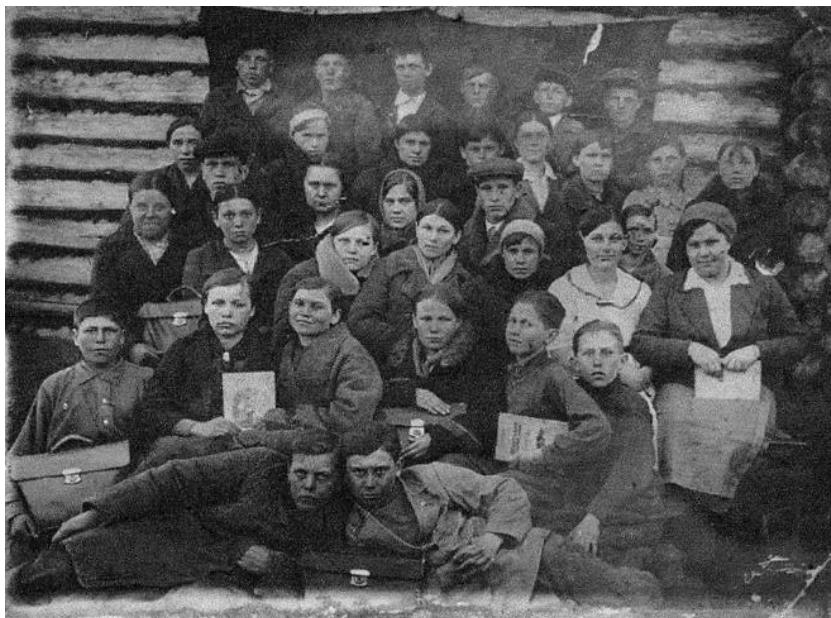
Выпускники Новомосковской неполной средней школы Октябрьского района. 1940/41 учебный год