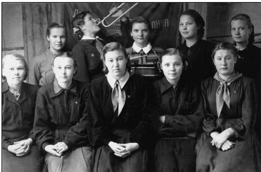
Ученицы Уйской средней школы. 50-е гг. XX в.