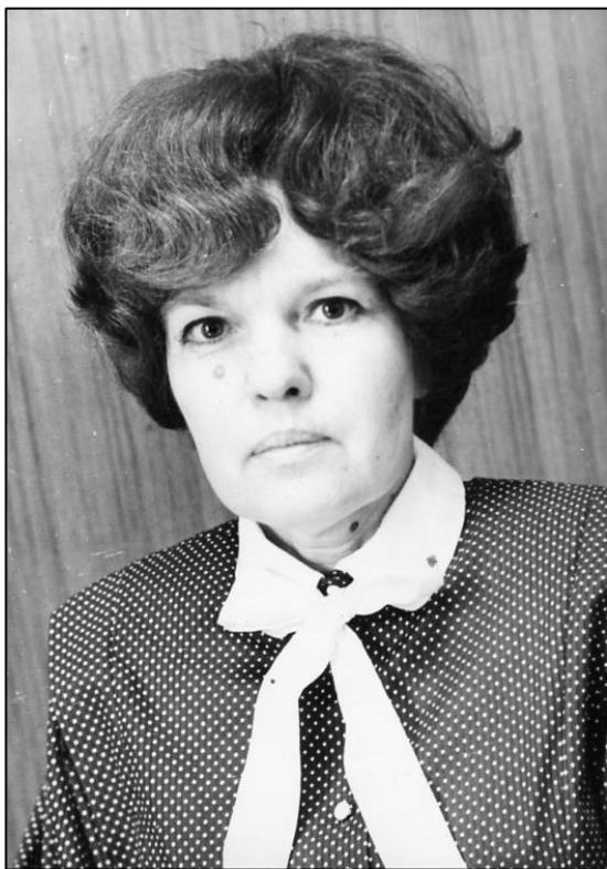
Народный учитель СССР Э.А. Заматохина