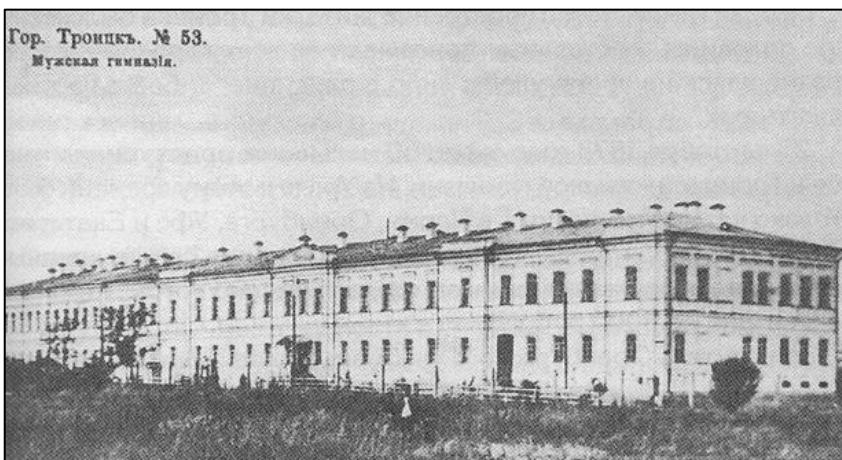
Здание общеобразовательной школы императорской России в г. Троицке на территории современной Челябинской области