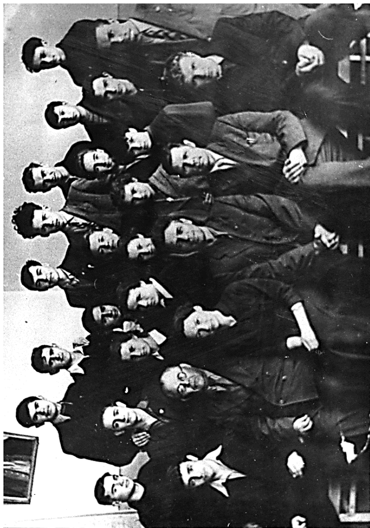
Учителя и ученики Еткульской средней школы