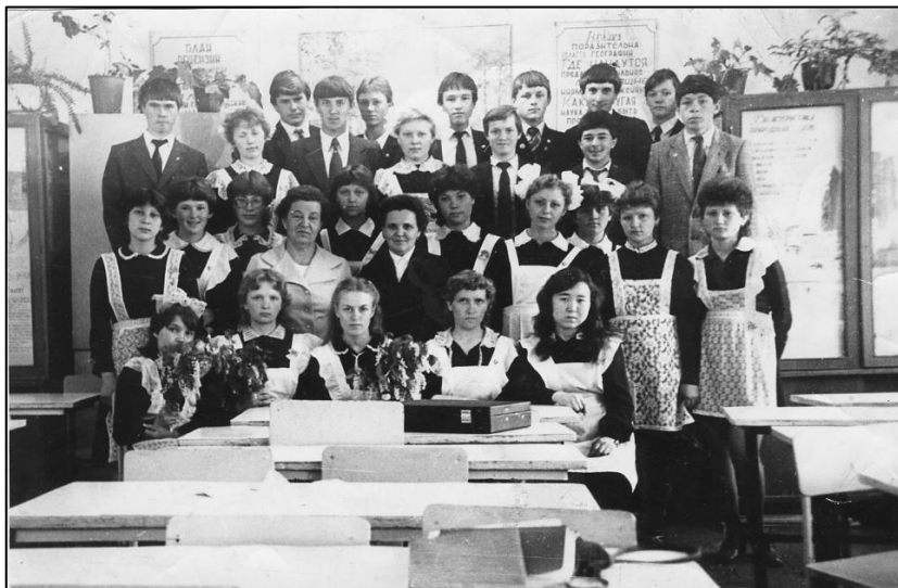
Ученики Уйской средней школы. 70-е гг. XX в.