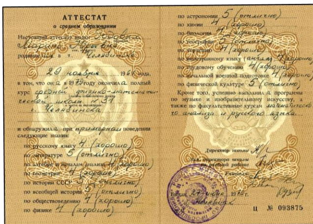
Аттестат об окончании советской средней общеобразовательной школы