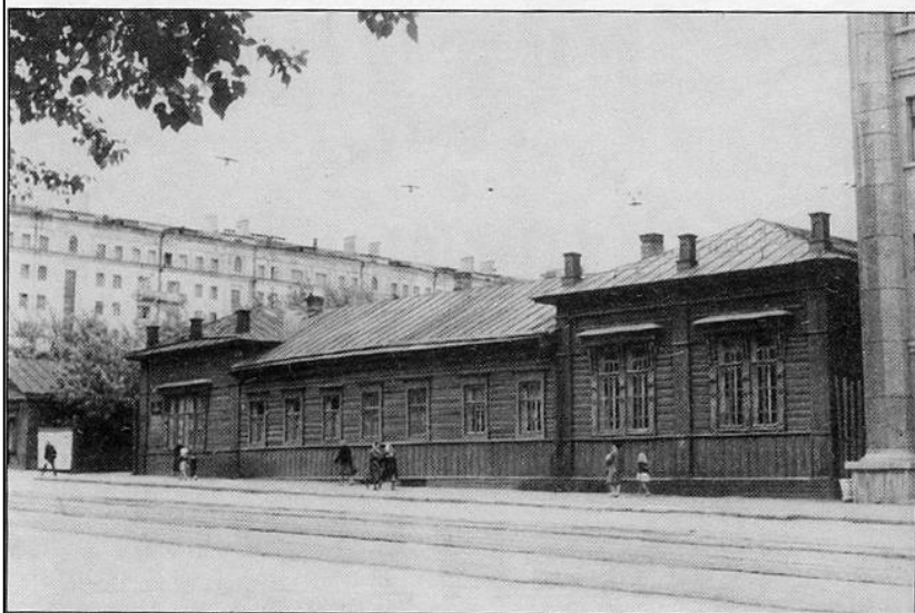
Первое здание женской гимназии (ныне на этом месте находится выставочный зал Союза художников РФ). 1960-е годы