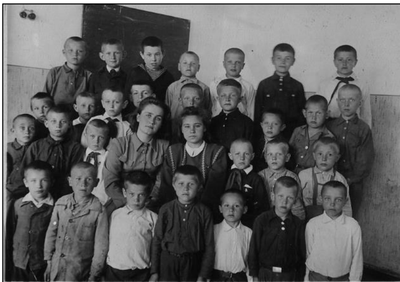
3-й класс Златоустовской мужской школы