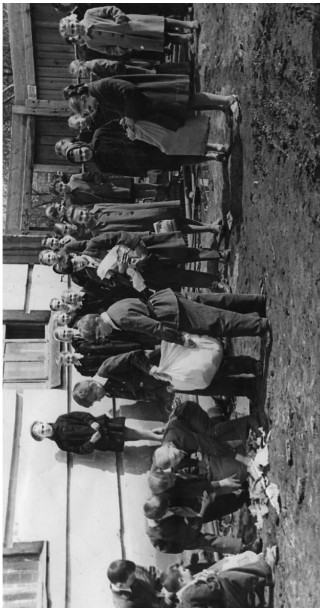
На субботнике ученики младших классов. школа № 121. апрель 1965 г.