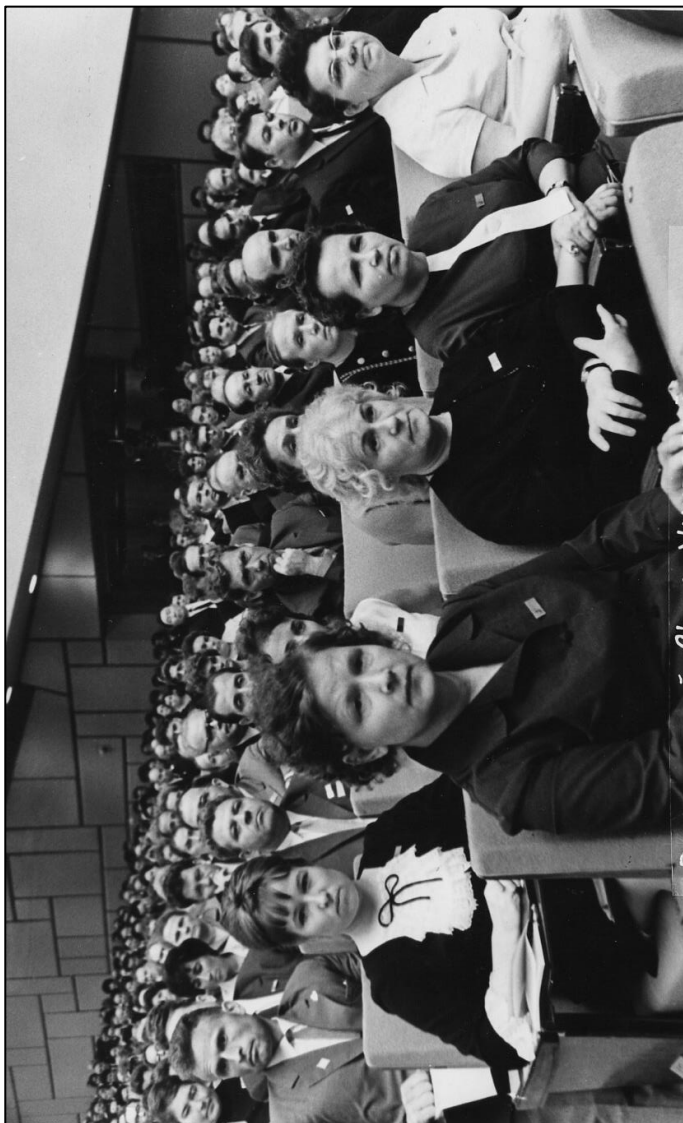
Всероссийный съезд учителей. Москва. Июль 1968 г. Делегация Челябинской области.