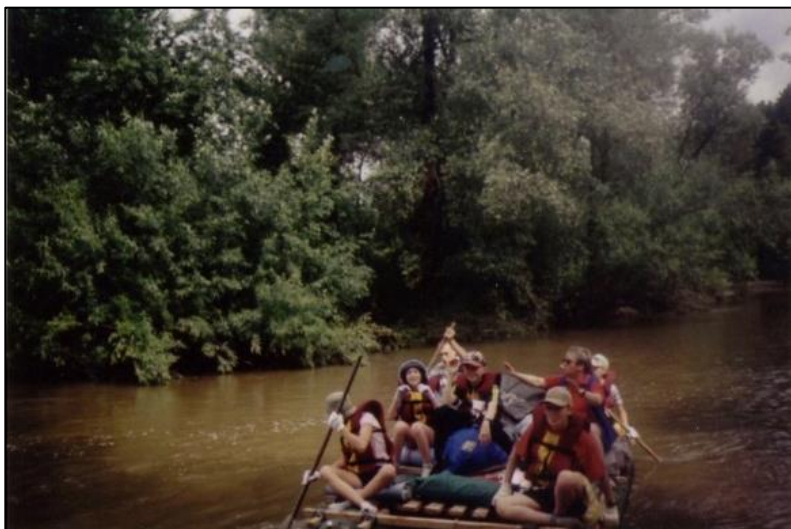
Спортивно-массовая работа в школе