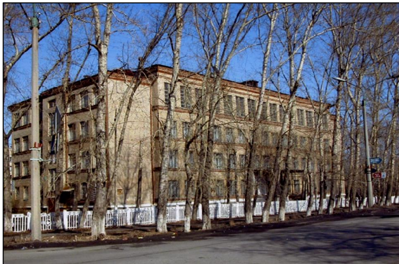
МАОУ СОШ № 145 г. Челябинска