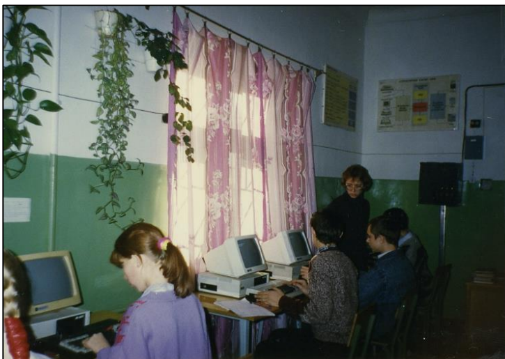
Кабинет информатики школы № 46 г. Челябинска