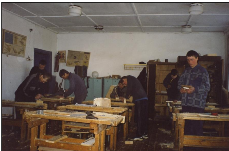
Серпиевская средняя школа. В школьной мастерской