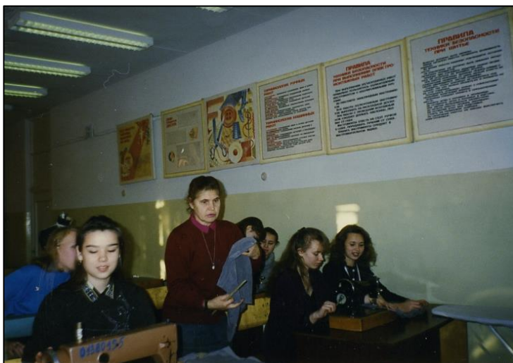
Кабинет труда и домоводства школы № 46 г. Челябинска