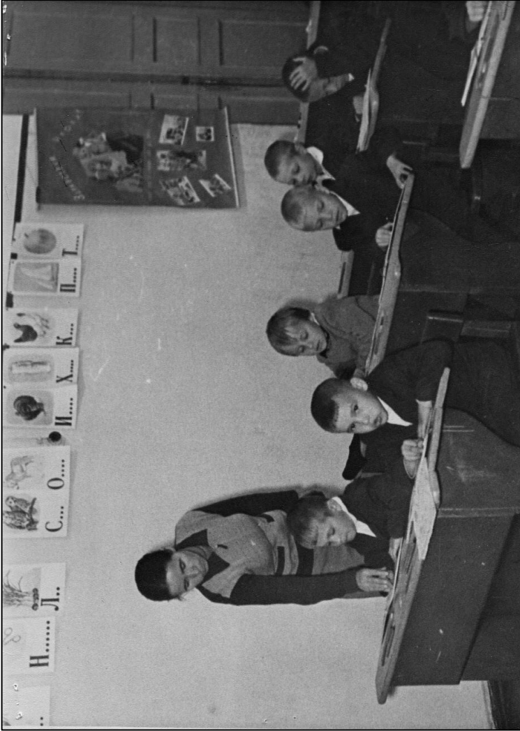
Ученики первого класса сельской школы