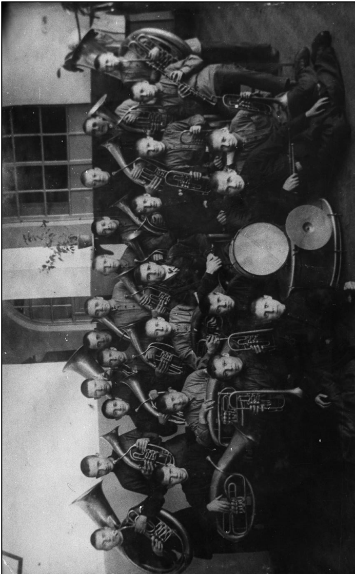
Школьный духовой оркестр