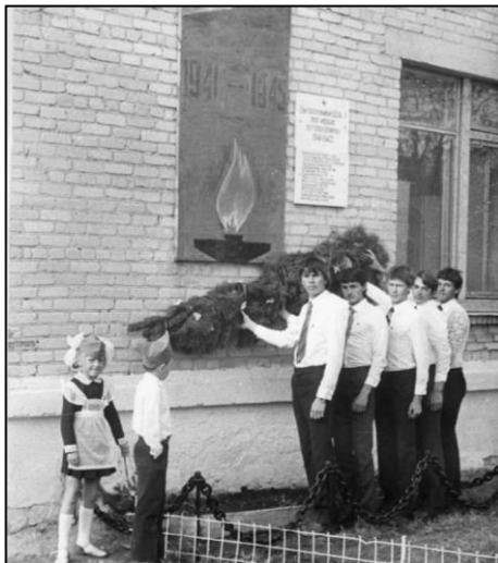
Брединская МОУ СОШ № 1. Возложение гирлянды славы к мемориальной доске с именами выпускников школы, погибших в годы великой отечественной войны. 9 мая 1985 г.