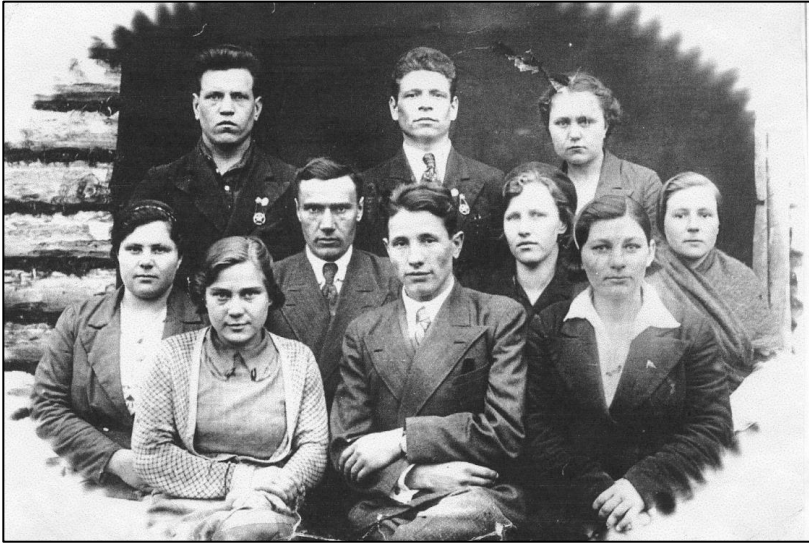
Коллектив Новомосковской школы. 40-е гг. XX в.