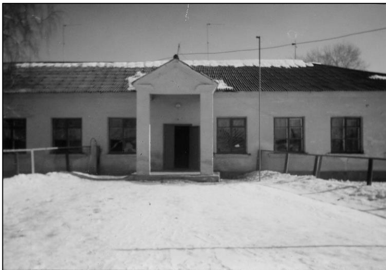
Здание Есаульской средней школы Сосновского района