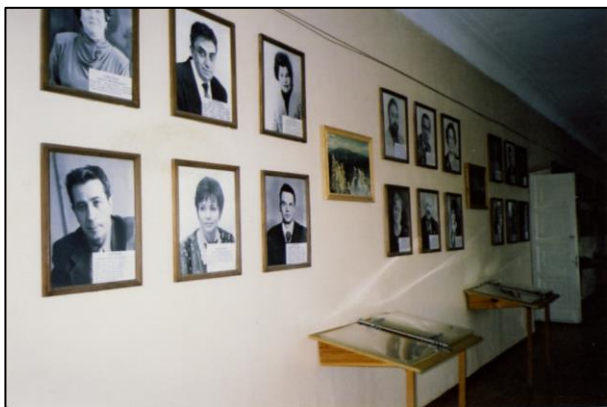
Музей истории народного образования Челябинской области в Челябинском пединституте (ныне ЮУрГГПУ). Портретная галерея заслуженных учителей школы РСФСР и РФ. 2005 г.