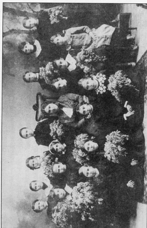
Выпуск I женского начального училища, 1913 г.