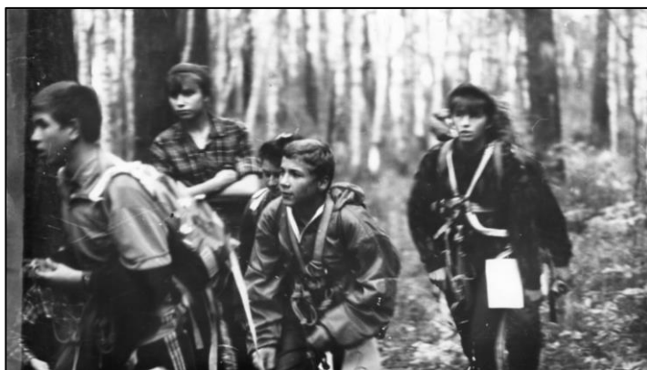
В походе. Ученики школы № 19 г. Челябинска