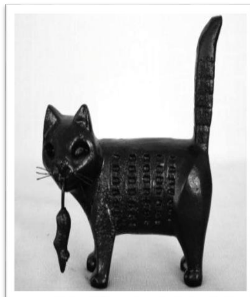
Скульптура «Кот и мышь»