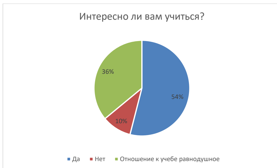
Рисунок 1 – Анализ ответов на вопрос 3

При анализе ответов на 3 и 4 вопрос анкеты о том, интересно ли вам учиться и почему, выяснилось, что 54 % студентов учатся с интересом; у 10% опрошенных интереса к учебе нет; у 36 % отношение к учебе равнодушное.