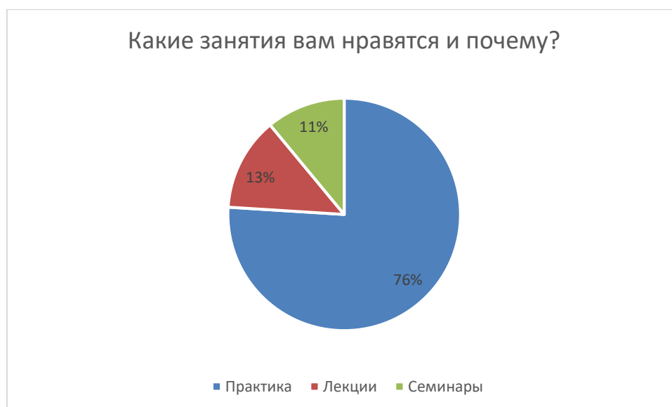
Рисунок 3 – Анализ ответов на вопрос 5

В практических занятиях студентов привлекает возможность самостоятельного исследования, проведения опыта, наблюдение и влияние на изучаемый процесс, приобретение практических навыков (57%). 11% ответивших считают, что практические занятия дают возможность приобрести новые знания, для 8% важна связь практикума с будущей специальностью.