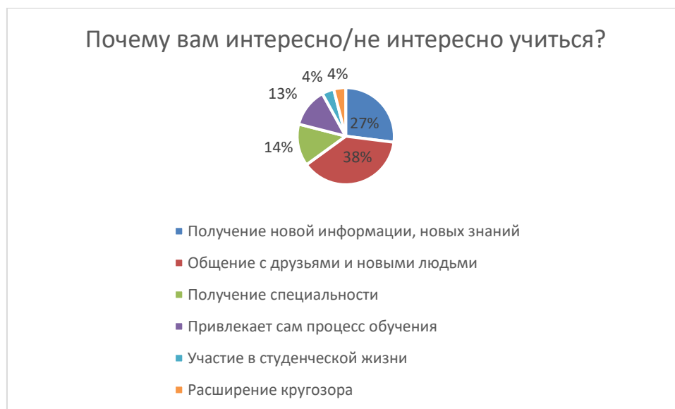
Рисунок 2 – Анализ ответов на вопрос 4

следующие: получение новой информации, новых знаний – 27%; для 38 % опрошенных важно общение с друзьями и новыми людьми; 14% ответивших свой интерес в обучении связывают с получением специальности; 13% респондентов привлекает сам процесс обучения; по 4% участников опроса отметили, что интерес вызван участием в студенческой жизни и расширением кругозора.