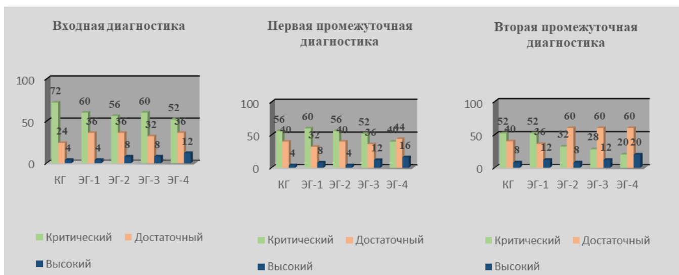
Рис. 10. Динамика уровня сформированности УК-1 у будущих педагогов профессионального обучения на констатирующем и формирующем этапах эксперимента

Для визуализации результатов представим данные об уровне сформированности УК-1 у будущих педагогов профессионального обучения на констатирующем (входная диагностика) и формирующем (первая и вторая промежуточные диагностики) этапах эксперимента на рисунке 10.