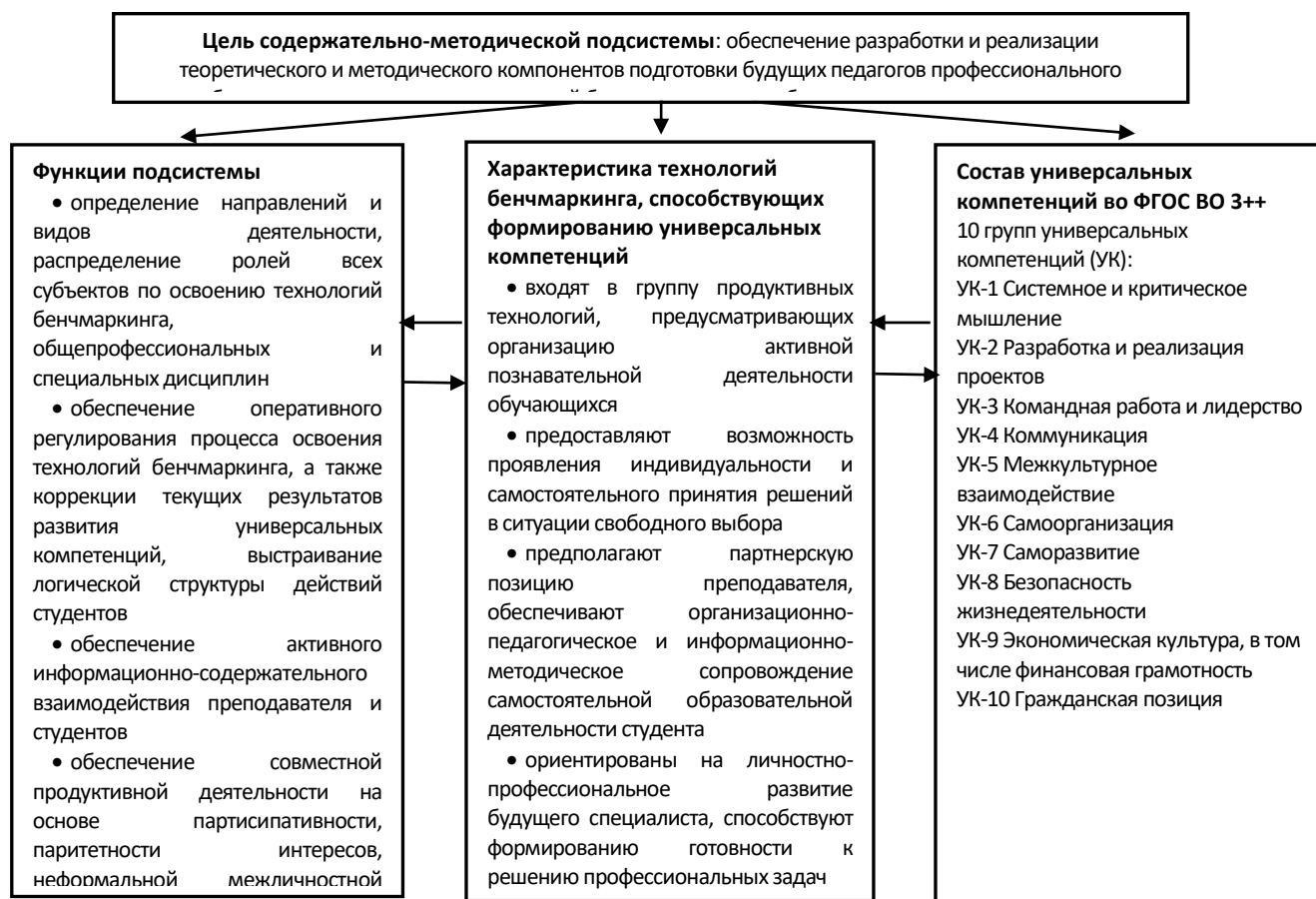
Рисунок 4. Содержательно-методическая подсистема системы подготовки будущих педагогов профессионального обучения с использованием комплекса технологий бенчмаркинга

В рамках данной подсистемы разрабатываются показатели качества процесса подготовки, составляется адекватный диагностический аппарат, формируется оценка, выявляются недостатки образовательного процесса и осуществляется их нивелирование. Основными методами оценивания являются: оценка, само- и взаимооценка, тестирование, наблюдение, а методами коррекции – консультирование, собеседование, анализ ошибок. В свою очередь среди средств оценивания основную роль играют тестовые материалы, групповые задания, самостоятельная работа, а среди средств коррекции – инструкции и рекомендации.