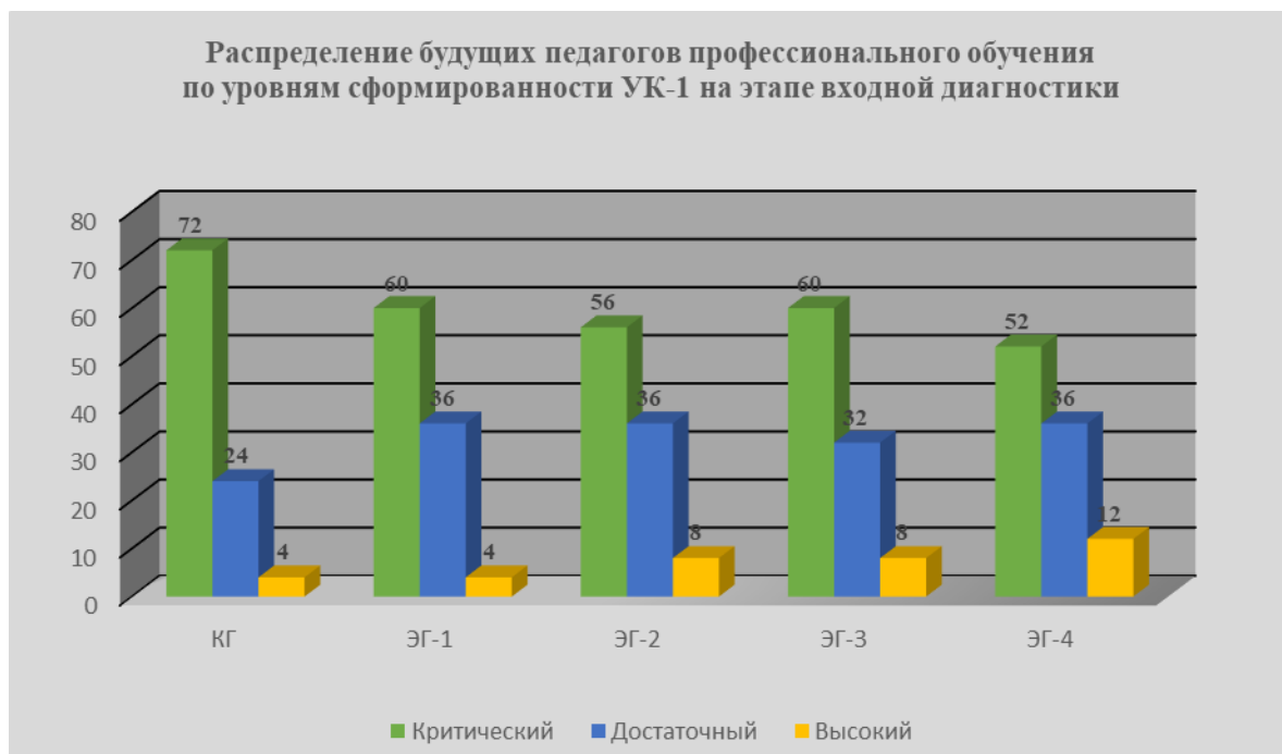
Рис.7. Результаты входной диагностики уровня сформированности УК-1 у будущих педагогов профессионального обучения

Результаты входной диагностики демонстрируют преобладание критического уровня сформированности УК-1 у будущих педагогов профессионального обучения во всех группах. Этот уровень характеризуется отсутствием у студентов ясного представления о будущей профессиональной деятельности, несформированностью мотивов и ценностей бенчмаркинговой деятельности, низким уровнем системного и критического мышления, необходимыми знаниями и умениями, что естественно в начале обучения, наличием недостаточно развитых профессионально значимых личностных качеств.