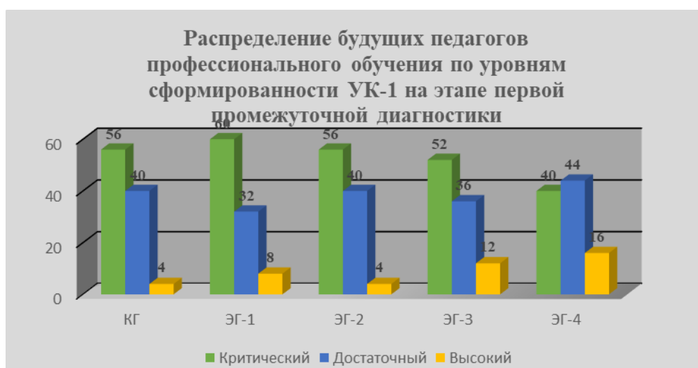
Рис. 8. Результаты первой промежуточной диагностики уровня сформированности УК-1 у будущих педагогов профессионального обучения

В ходе апробации разработанной системы и выявленных педагогических условий было установлено их позитивное влияние на процесс формирования УК-1, о чем свидетельствуют результаты в экспериментальных группах. Характерным для результатов экспериментальной работы является то, что положительные изменения произошли не только в экспериментах группах, но и в контрольной.