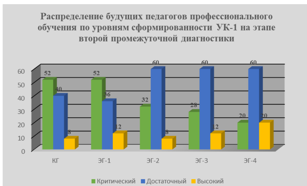
Рис. 9. Результаты второй промежуточной диагностики уровня сформированности УК-1 у будущих педагогов профессионального обучения

Полученные нами результаты повторной промежуточной диагностики сохраняют наметившиеся тенденции сокращения количества студентов с критическим уровнем сформированности УК-1 во всех экспериментальных группах: в ЭГ-1 – до 52%, в ЭГ-2 – до 32%, в ЭГ-3 – до 28%, в ЭГ-4 – до 20%. В контрольной группе рассматриваемый показатель, по сравнению с данными первой промежуточной диагностики, также незначительно снизился – до 52%.