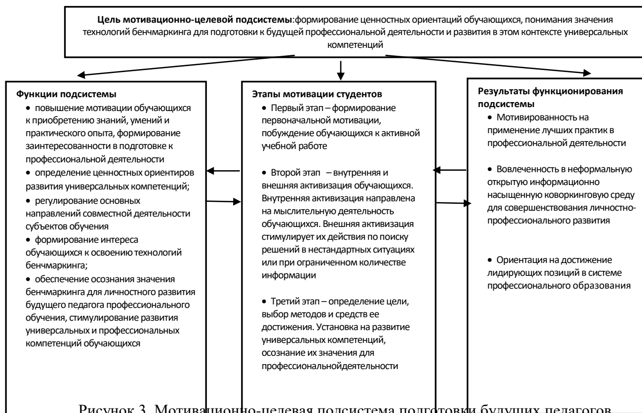
Рисунок 3. Мотивационно-целевая подсистема подготовки будущих педагогов профессионального обучения с использованием комплекса технологий бенчмаркинга

Цель: обеспечение разработки и реализации теоретического и методического компонентов подготовки будущих педагогов профессионального обучения с использованием технологий бенчмаркинга, способствующих в том числе развитию универсальных компетенций.