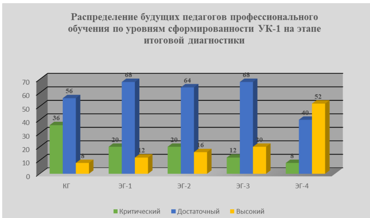
Рис.11. Результаты итоговой диагностики

Результаты итоговой диагностики показывают, что проведение экспериментальной работы значительно сократило во всех группах количество студентов с критическим уровнем сформированности УК-1. В группах КГ, ЭГ-1, ЭГ-2 и ЭГ-3 сокращение сопровождается значительным ростом показателей достаточного уровня и повышением процента обучающихся с высоким уровнем сформированности УК-1. Наиболее выраженная положительная динамика зафиксирована в экспериментальной группе ЭГ-4, где разработанная система реализовалась с использованием всех педагогических условий. В этой группе осталось наименьшее количество обучающихся с критическим уровнем сформированности УК-1 (2 чел. или 8%), 52% обучающихся этой группы показали высокий уровень сформированности, что свидетельствует о повышении качества подготовки будущих педагогов профессионального обучения и позволяет говорить об эффективности разработанной системы и установленных педагогических условий.