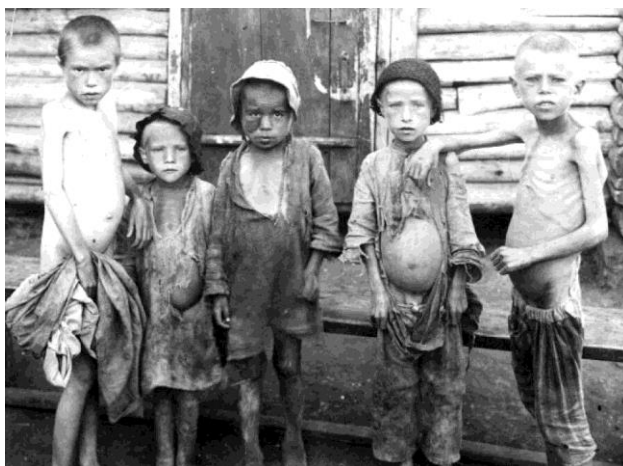
Голодные дети в 1920 -е годы