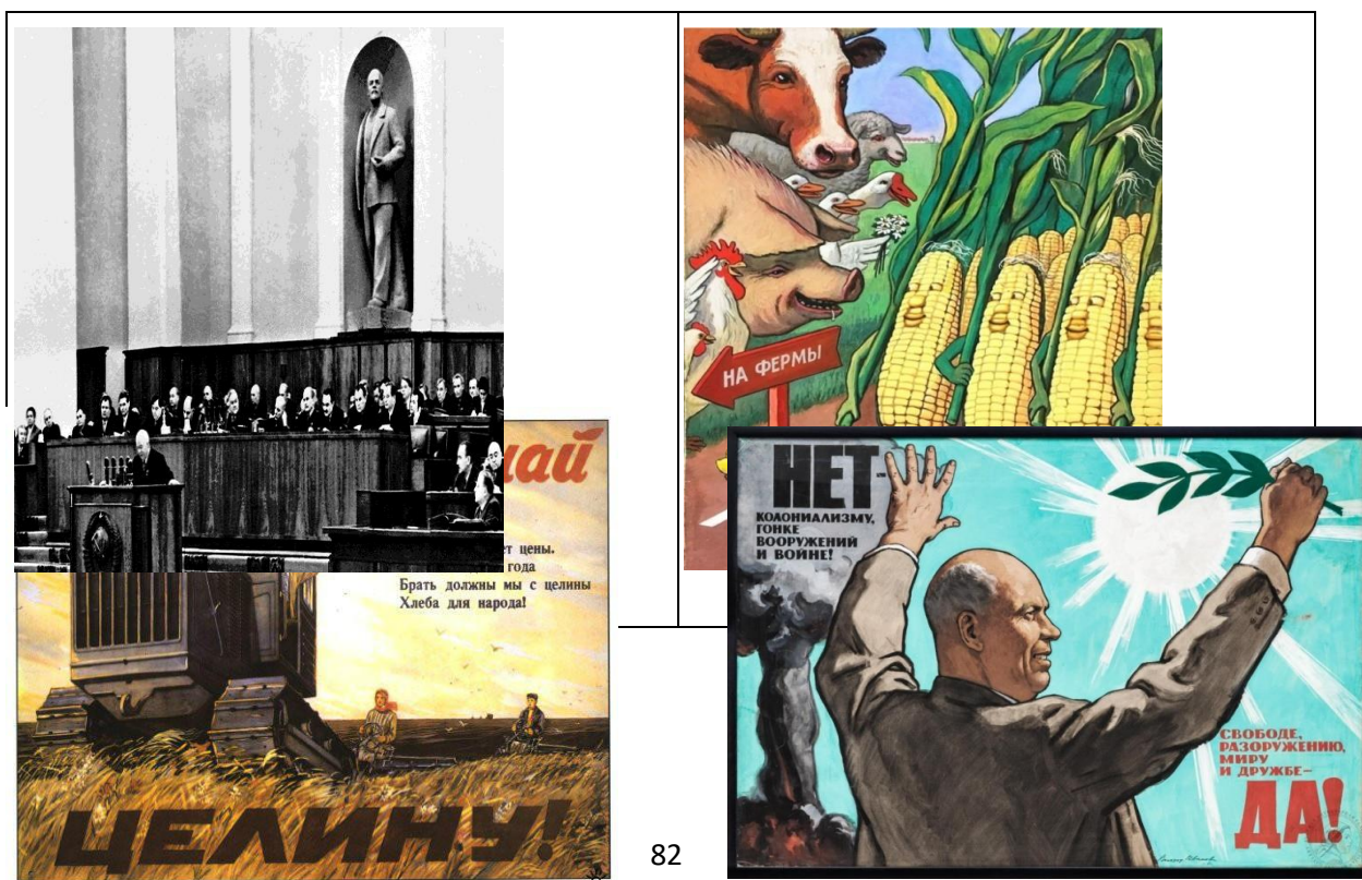
Фото и агитационные плакаты 1960-х гг.

Быстрый рост населения и опережающее развитие промышленности, несмотря на непрерывно возрастающий объем жилищного строительства, привели к тому, что проблема жилья все еще продолжает оставаться одной из самых острых. Население многих городов, рабочих поселков и сел испытывает нужду в благоустроенных жилищах. Значительное количество семейств еще проживает в ветхих домах.