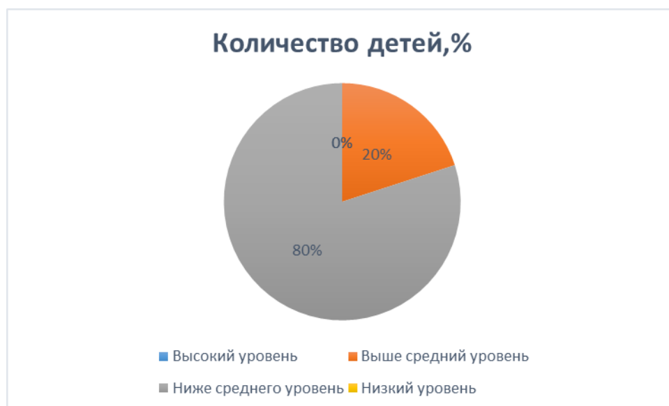
Рис. 2. Уровни сформированности звукопроизношения у дошкольников с дизартрией

испытуемых (80%) указанный уровень ниже среднего. Представим полученные данные на рис. 2.