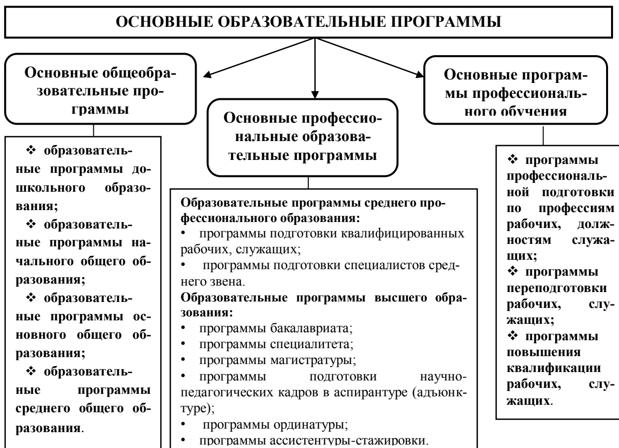
Рис. 3 – Основные образовательные программы в РФ

К основным образовательным программам относятся (Рис. 3):