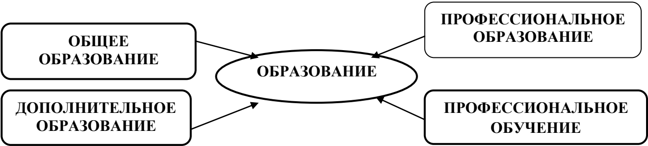
Рис. 2 – Виды образования

2. Образование подразделяется на общее образование, профессиональное образование, дополнительное образование и профессиональное обучение, обеспечивающие возможность реализации права на образование в течение всей жизни (непрерывное образование) (Рис.2).