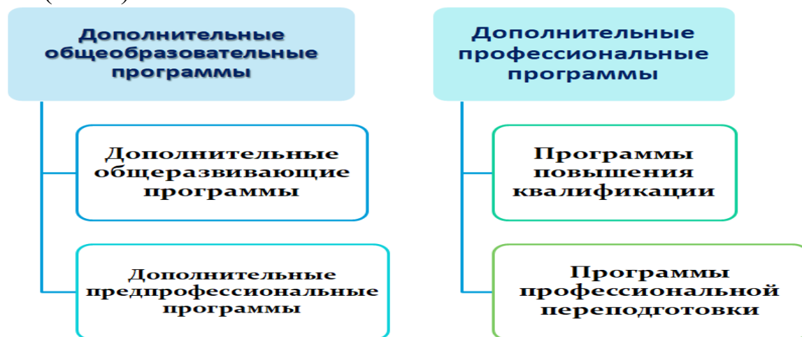
Рис. 4 – Дополнительные образовательные программы в РФ

К дополнительным образовательным программам относятся (Рис.4):