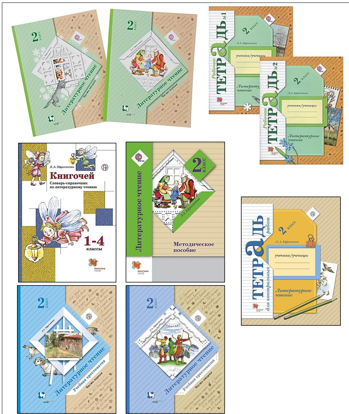
Рисунок 2 – «Литературное чтение. 2 класс», автор: Ефросимина Л. А., УМК «Начальная школа XXI века»

С внешним видом учебно-методического комплекта можно ознакомиться на рисунке 2.