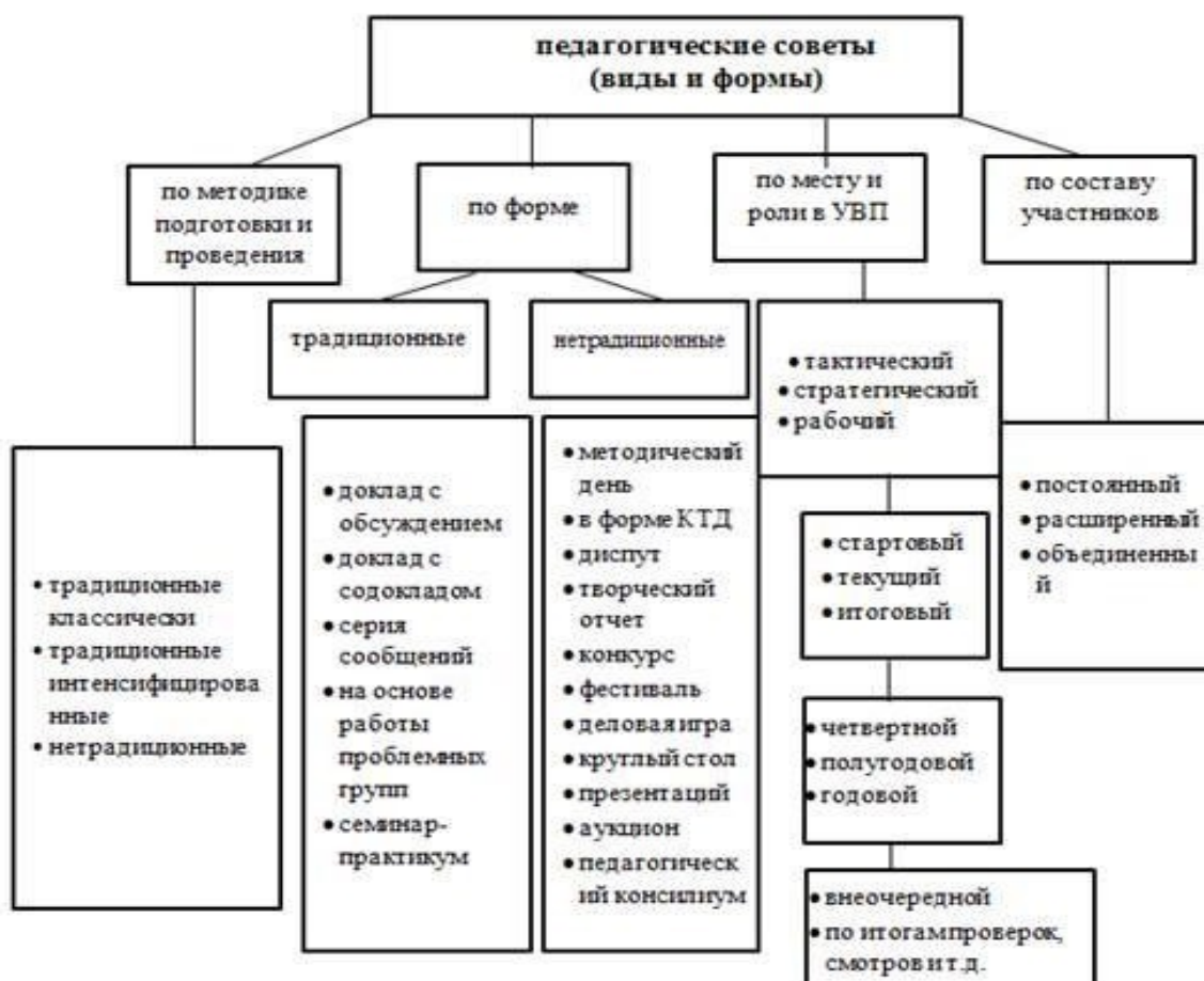
Рисунок 2 – Виды и формы педагогических советов

Наряду с этим на педсовете может не быть основного доклада, который заменяется серией сообщений, объединенных одной тематикой.