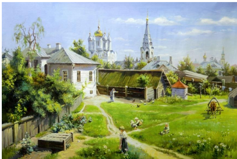
Рисунок 1 – В. Поленов «Московский дворик»

4) какие слова из стихотворения З. Александровой могли бы стать названием этой картины?