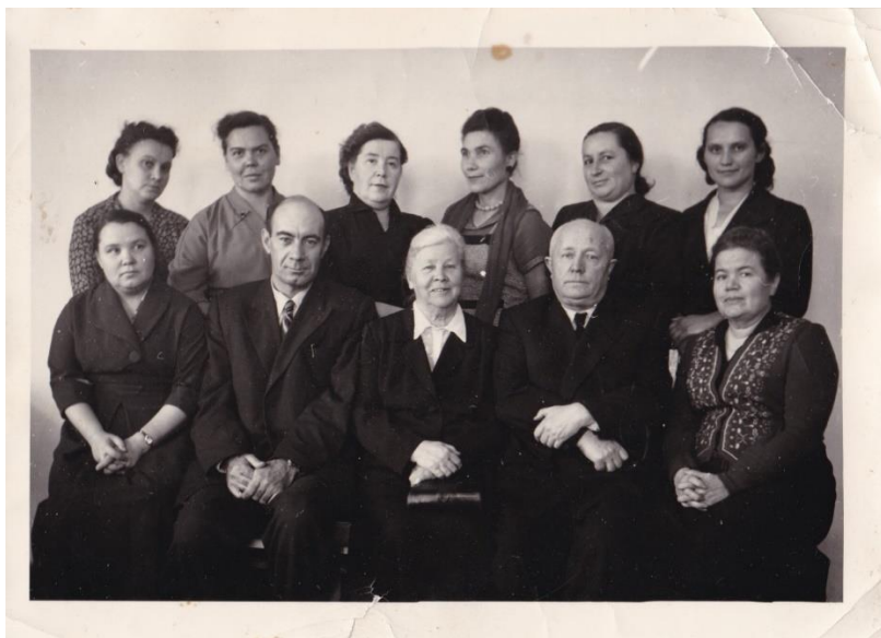
Рис. 1. Преподаватели кафедр русского языка и литературы (ок. 55–57-го гг. XX в., фотография).

ученой степени кандидата филологических наук на тему «Сложноподчиненные предложения с придаточными, присоединяемыми сравнительными союзами, в русском литературном языке второй половины XVIII–XX вв.». В то время это была «единственная специальная работа, в которой всесторонне описывались придаточные с сравнительными союзами в языке XVIII века.