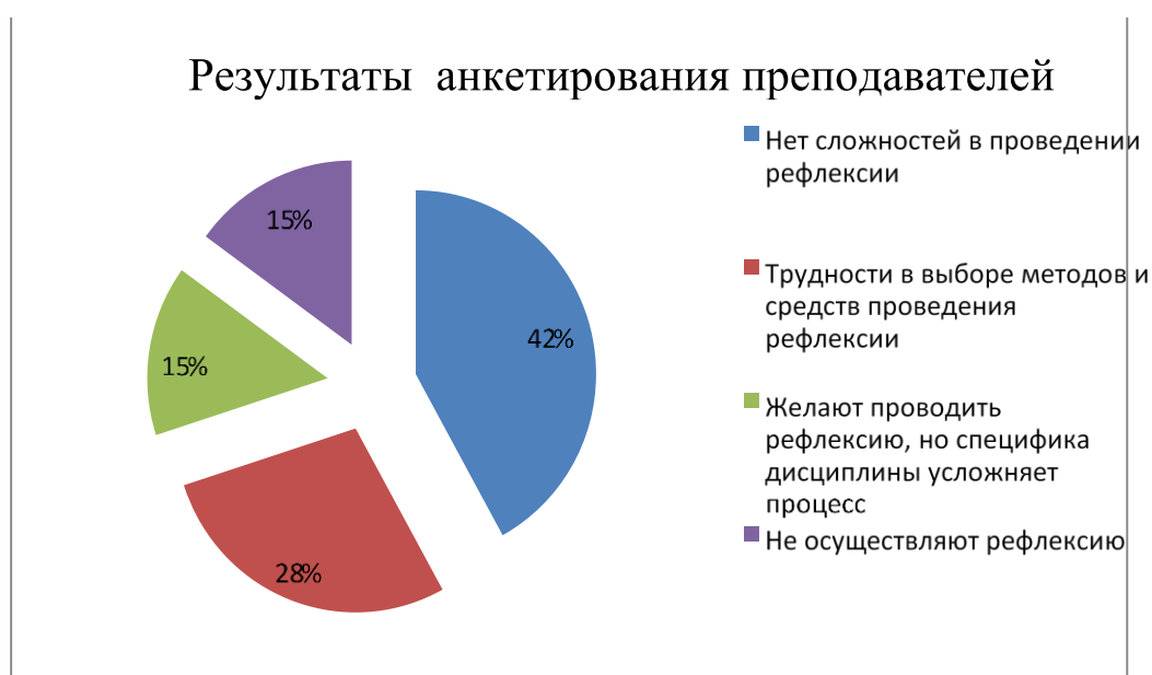
Рис. 1. Исследование характера затруднений в проведении рефлексии у преподавателей

На диагностическом этапе был исследован характер затруднений в проведении рефлексии у преподавателей. С целью определения сложностей у преподавателей в организации рефлексии учебной деятельности, было проведено анкетирование (Приложение 1). В анкете были представлены вопросы, которые позволили узнать, какие затруднения испытывают педагоги при проведении рефлексии учебной деятельности у студентов.