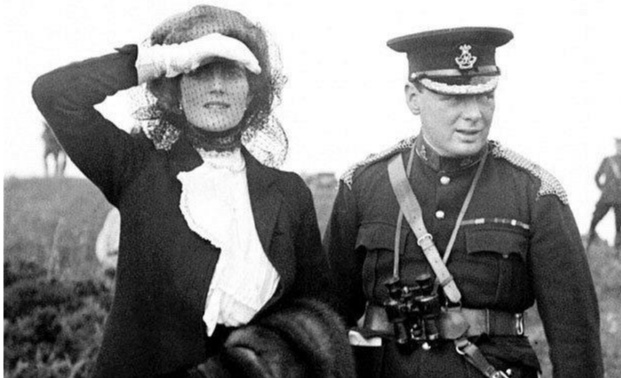
Приложение 3. Уинстон Черчилль с семьей.