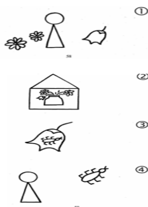
Рисунок 2 – Пиктограмма к заданию 2