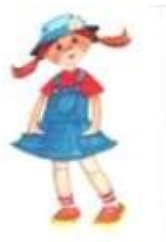
Рисунок 3 – Предметные (опорные) картинки к заданию 3.