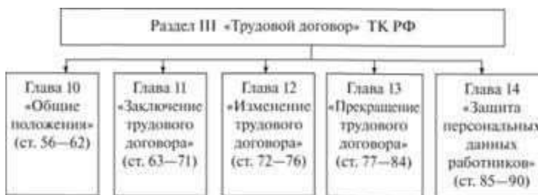
Рисунок 1 - Трудовой договор в Трудовом кодексе РФ

На рисунке 1 приведен фрейм по теме «Трудовой договор в Трудовом кодексе РФ».