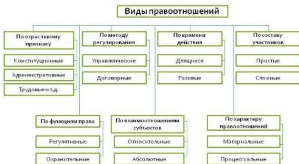
Рисунок 3 - Виды правоотношений

В конце занятия преподаватель с целью взаимосвязи изучаемой темы с другими темами учебной дисциплины предложил классификацию правоотношений в виде опорного конспекта, представленного схемой (рис. 3), что, с одной стороны, позволило расширить объем знаний студентов, с другой, обратить внимание на классификацию правоотношений в зависимости от признака, по которому осуществляется деление на виды существующих правоотношений.