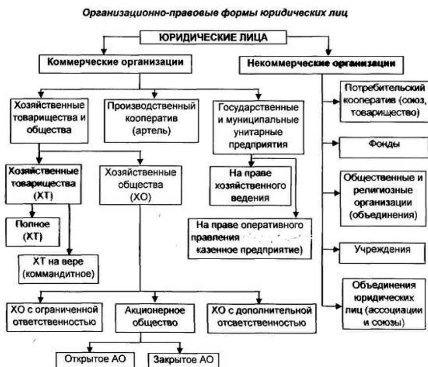
Рисунок 4 - Организационно-правовые формы юридических лиц

Студенты при изучении учебной дисциплины «Правовые основы профессиональной деятельности» чаще всего в процессе самостоятельной работы составляют опорные конспекты только в самом простом виде - в виде таблиц.