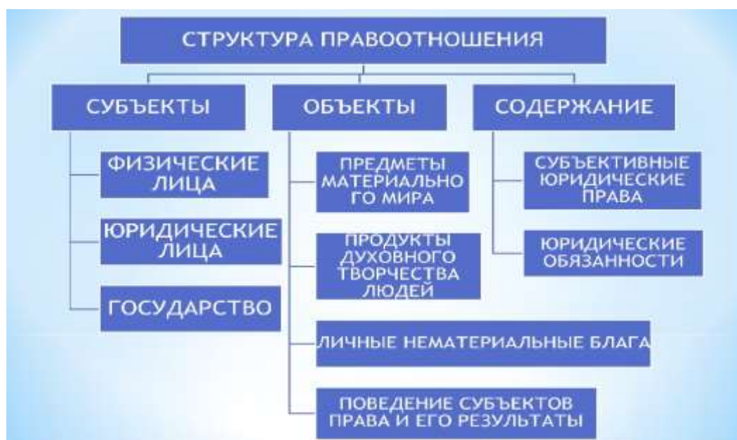
Рисунок 2 - Структура правоотношения

Приведем примеры опорных конспектов, используемых преподавателем. При изучении темы «Основные положения Конституции Российской Федерации, действующие законодательные и иные нормативно-правовые акты, регулирующие правоотношения в процессе профессиональной (трудовой) деятельности» преподаватель для понимания студентами сущности понятия «правоотношение» предложил опорный конспект «Структура правоотношения», на основе которого происходило усвоение теоретического материала по конкретному виду правоотношений (рис. 2).