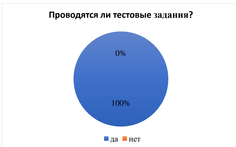
Рисунок 1 – ответы студентов.

Ответы студентов распределились таким образом (рисунок 1).