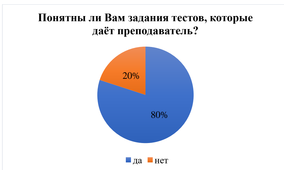
Рисунок 3 – Понятны ли Вам задания тестов, которые даёт преподаватель?

Ответы студентов распределились таким образом (рисунок 3).