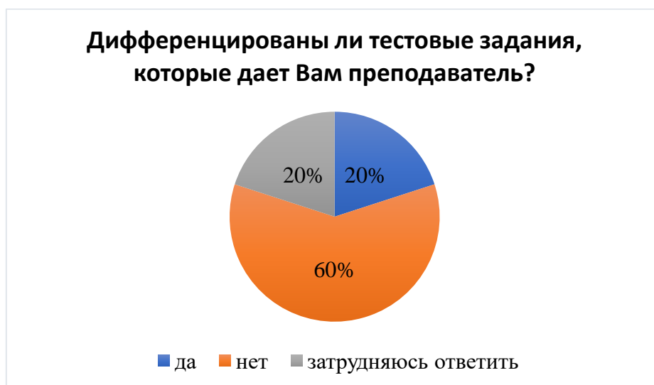
Рисунок 2 – Дифференцированы ли тестовые задания?

Ответы студентов распределились таким образом (рисунок 2).