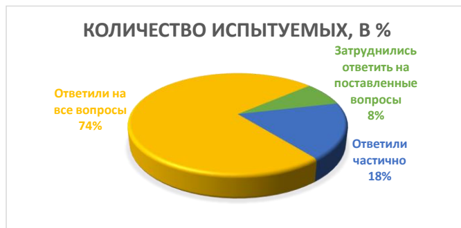
Рисунок 2 – Результаты анкетирования

При сравнении диаграмм выявляется такая картина изменений: на первоначальном этапе анкетирования при ответе на вопросы: полностью ответили на вопросы – всего 27%, после прохождения полного курса дисциплины «История стилей в костюме» этот показатель повысился – до 74%. Соответственно изменились показатели: ответили частично было – 33%, после изучения стало – 17%. Затруднились ответить на поставленные вопросы: показатель изменился с 40% до 8%.