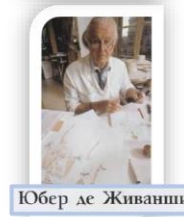
Юбер де Живанши