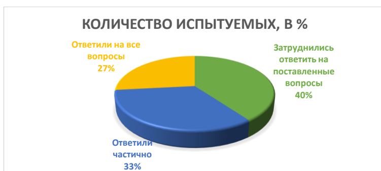
Рисунок 1 – Результаты анкетирования

В процессе опроса были выявлены следующие знания. Для правильного понимания получившейся картины стоит рассмотреть диаграмму, которая представлена на рисунке 1.