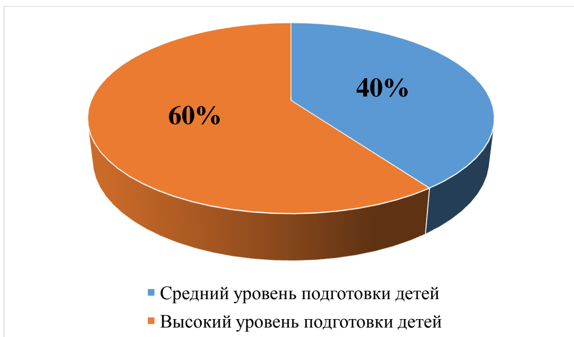
Рисунок 3. Результаты диагностики заключительного этапа

На рисунке 3 полученные результаты отображены в виде диаграммы.