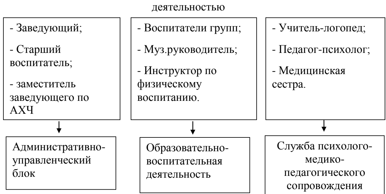
Схема управления образовательной и здоровьесберегающей

В предложенной нами программе управления здоровьесбережением «Здоровей-ка», отражены следующие направления деятельности: