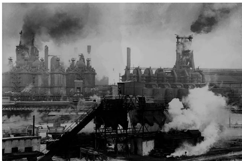
Магнитогорский металлургический комбинат. Магнитка победила Рур