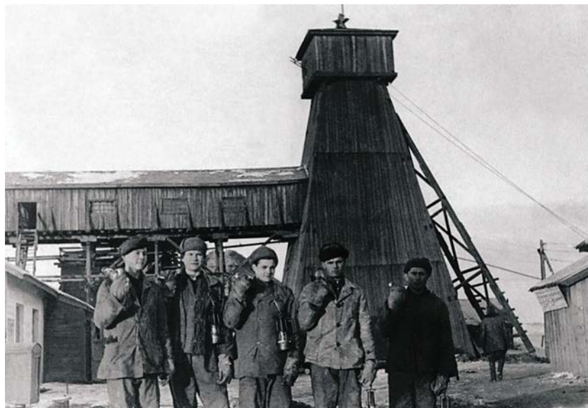
Копейск. Шахта № 16. Комсомольско-молодежная фронтовая бригада навалотбойщиков. 1943 г.