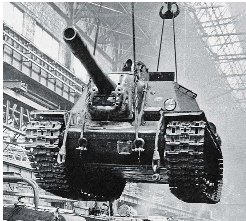
Челябинск. Кировский завод. Сборка танков