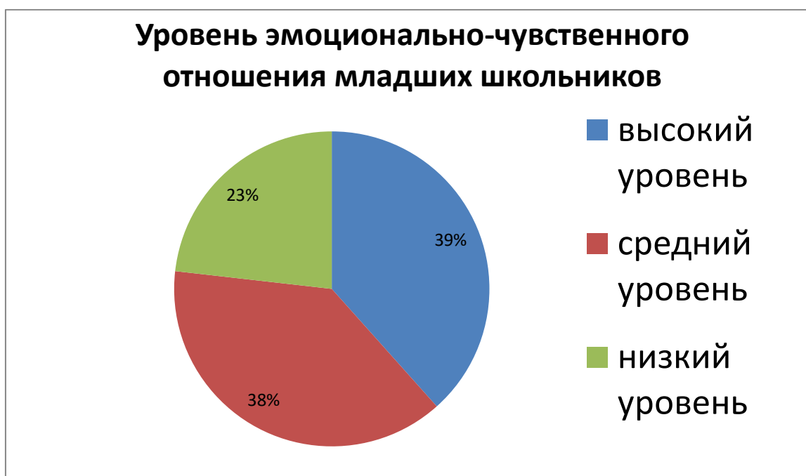
Рис. 3 Уровень эмоционально-чувственного отношения младших школьников (экспериментальная группа)

Результаты анализа уровня эмоционально-чувственного отношения младших школьников к своей Родине показаны на рисунках ниже.