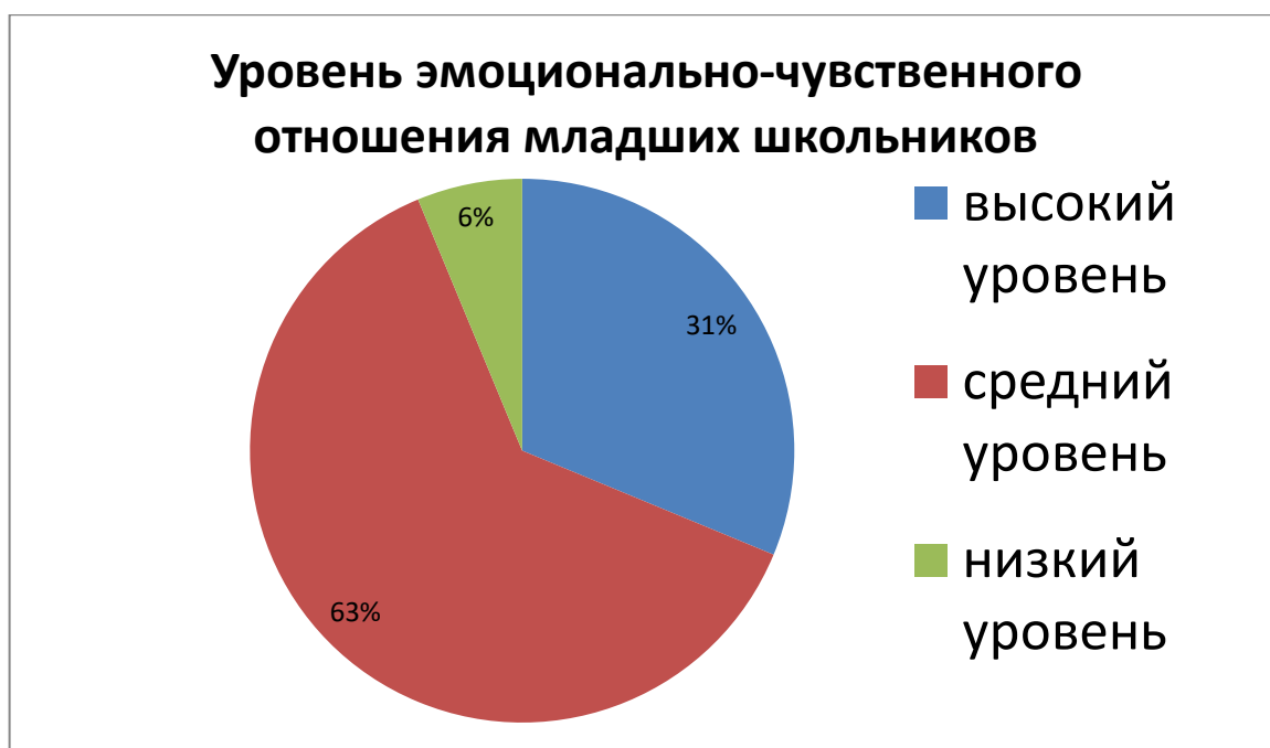
Рис. 4 Уровень эмоционально-чувственного отношения младших школьников (контрольная группа)

Таким образом, делаем вывод, что в экспериментальной группе преобладает высокий и средний уровень эмоционально-чувственного отношения, а в контрольной группе средний уровень.