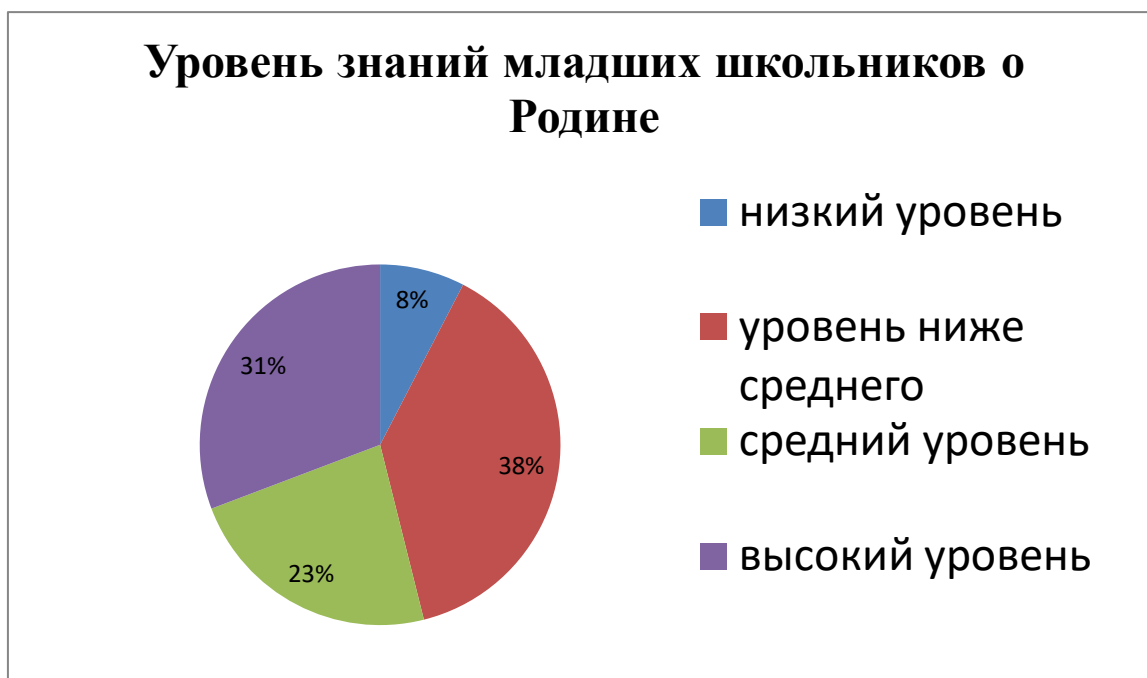
Рис. 5 Уровень сформированности когнитивной составляющей патриотического воспитания у младших школьников по результатам методики «Незаконченные предложения» (экспериментальная группа)

эксперимента, понизился. В контрольной группе преобладает уровень ниже среднего (рис 6).