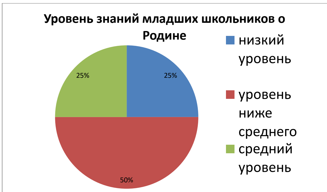
Рис. 6 Уровень сформированности когнитивной составляющей патриотического воспитания у младших школьников по результатам методики «Незаконченные предложения» (контрольная группа)