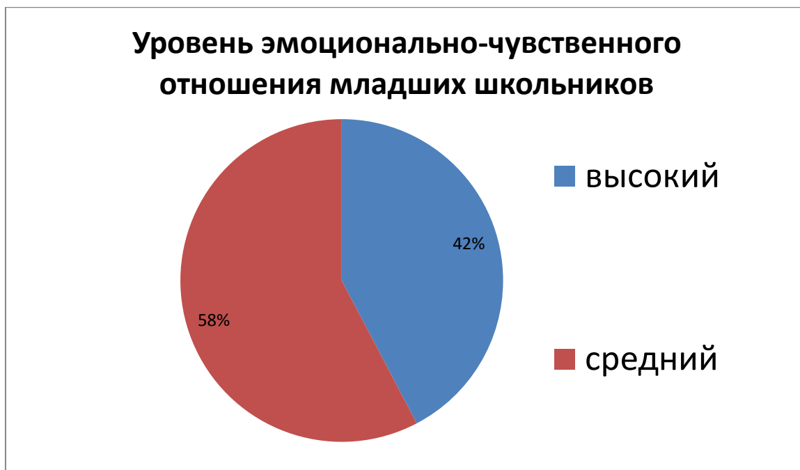
Рис. 6 Уровень эмоционально-чувственного отношения младших школьников (экспериментальная группа)

Данная диаграмма (рис.6) показывает, что на контрольном этапе эксперимента в экспериментальной группе преобладает процент обучающихся со средним уровнем эмоционально-чувственного отношения к окружающему миру, Родине и семье, так же вырос процент обучающихся с высоким уровнем. А обучающихся с низким уровнем эмоционально-чувственного отношения выявлено не было.