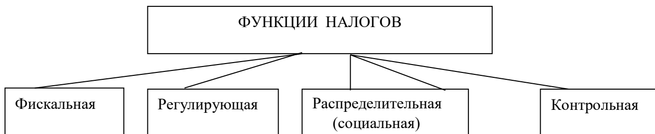
Рис.1.1. Функции налогов

– контрольная. Через налоги государство может контролировать финансовое положение организаций, источники доходов юридических и физических лиц, выявлять факты неполной или несвоевременной уплаты налогов и на этой основе разрабатывать рекомендации по совершенствованию деятельности хозяйствующих субъектов. Контрольная функция позволяет оценить эффективность каждого налогового канала, выявить необходимость внесения изменений в налоговую систему и бюджетную политику. Контрольная функция налогов проявляется лишь в условиях действия других функций налога и представлена на рисунке 1.1.