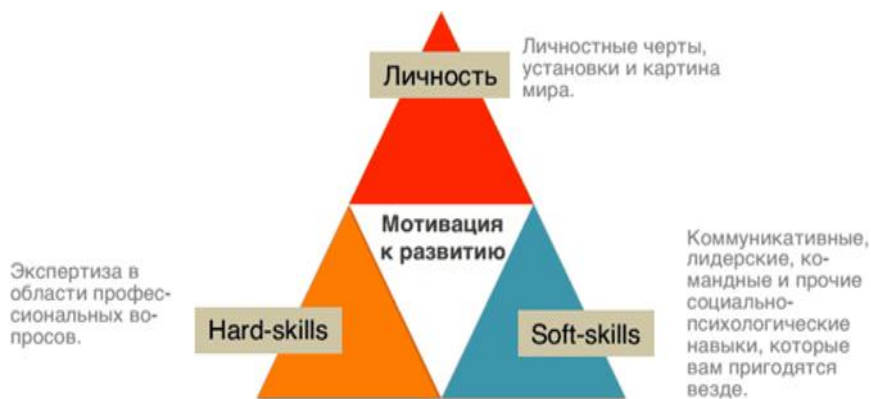
Рисунок 1 – Треугольник успешного личного и профессионального развития каждого человека

Мягкие навыки важны как в личной жизни, так и в выполнении профессиональных обязанностей и вообще при взаимодействии с другими людьми. Самые успешные люди мира в своих интервью указывают на то, что есть более грамотные, более узкопрофильные и более одаренные специалисты, чем они.