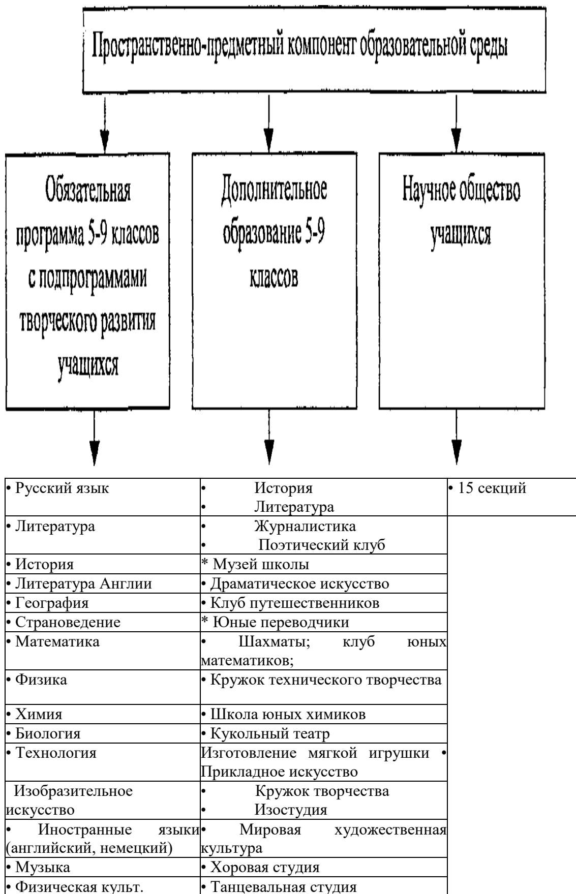
Схема 8 управления развитием творческих способностей учащихся Пространственно-предметный компонент образовательной среды