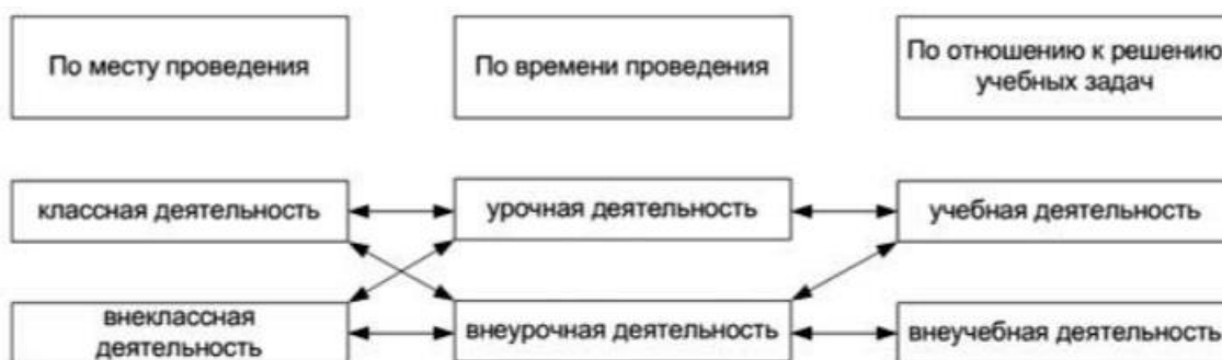
Рисунок 1 - Взаимосвязь различных видов деятельности школьников (А.Л. Трофимова)

Теперь следует рассмотреть взаимосвязь деятельности школьников по времени проведения и по отношению к учебным задачам.