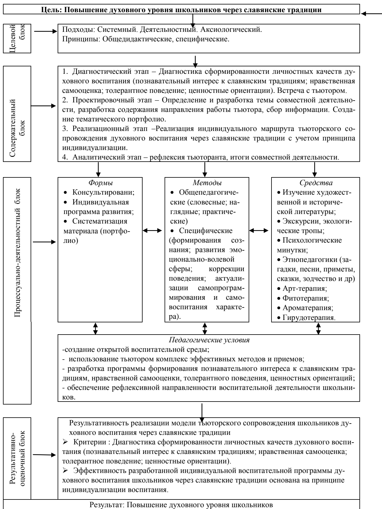
Рис.1. Модель тьюторского сопровождения духовного воспитания школьников через славянские традиции