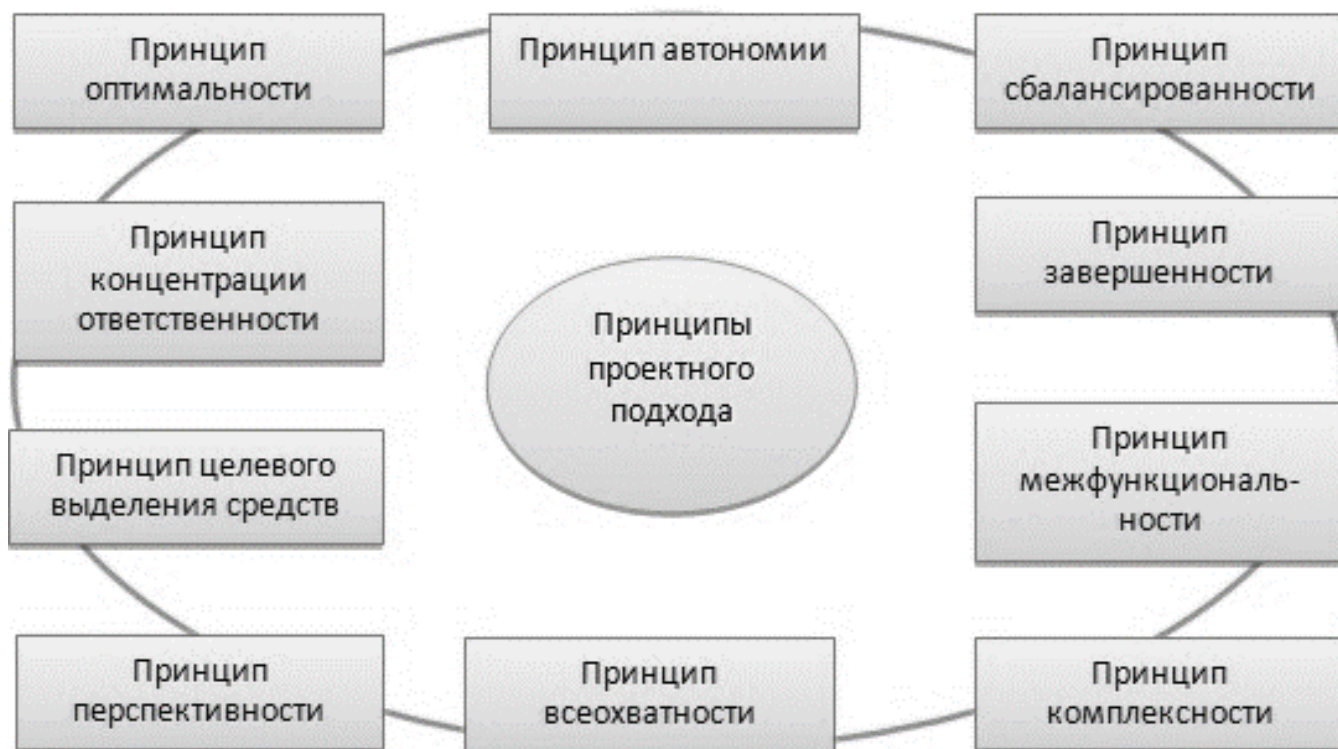
Рис. 1. Принципы проектного подхода в управлении

Интеграция и преемственность в системе профессионального образования.