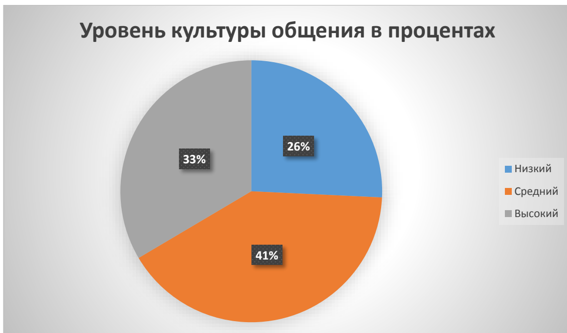
Рис. 2 - Диаграмма общего уровня культуры общения со сверстниками детей старшего дошкольного возраста, в %

Таким образом, у детей старшего дошкольного возраста в исследуемой нами группе превалирует средний уровень культуры общения, что говорит о необходимости разработки комплекса мероприятий по повышению уровня культуры общения детей старшего дошкольного возраста со сверстниками.