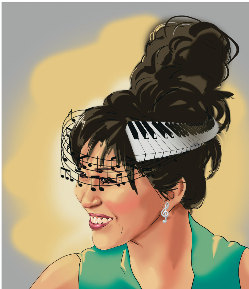
Рис. 5. Плакат из разработки серии плакатов «Концерт известного исполнителя». Яшкина А. С. Выпуск 2019 г.