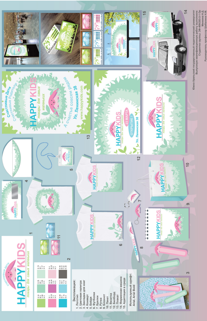
Рис. 8. Разработка графических элементов для рекламно-информационных материалов компании. Минкина М.Д. Выпуск 2020 г.

Разработка стиля графических элементов для рекламно-информационных материалов компании «HAPPYKIDS»