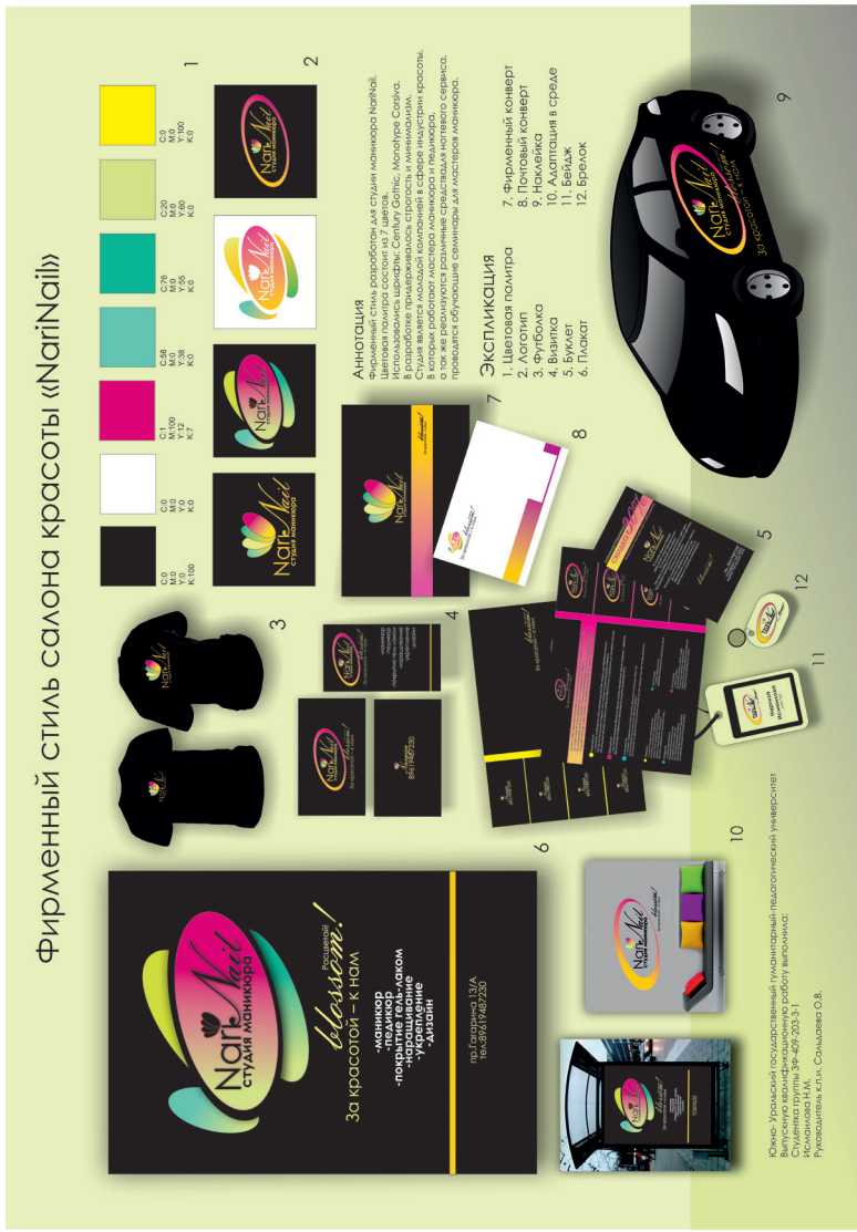
Рис. 7. Фирменный стиль салона красоты «NagiNail». Исмаилова Н. М. Выпуск 2020 г.