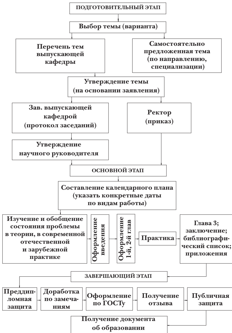
Схема. 1. Этапы подготовки и защиты ВКР студента-выпускника