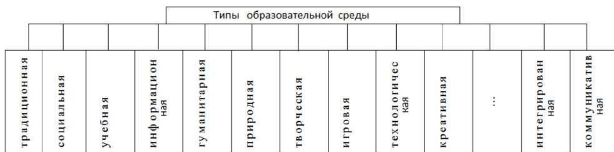
Рис.1. Типы образовательной среды