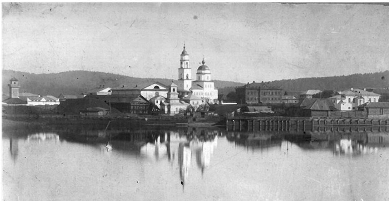
Церковь Святого Николая в Саткинском заводе, 1913 год 55