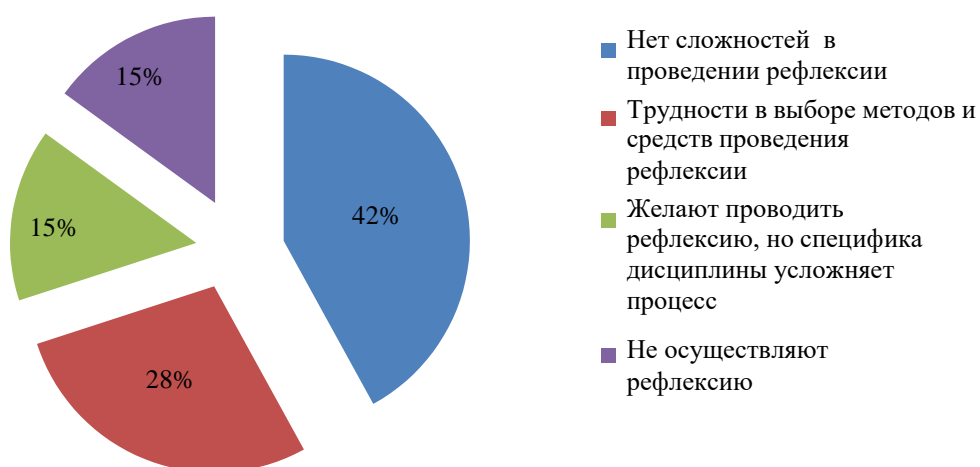
Рис. 1 – Исследование характера затруднений в проведении рефлексии у преподавателей