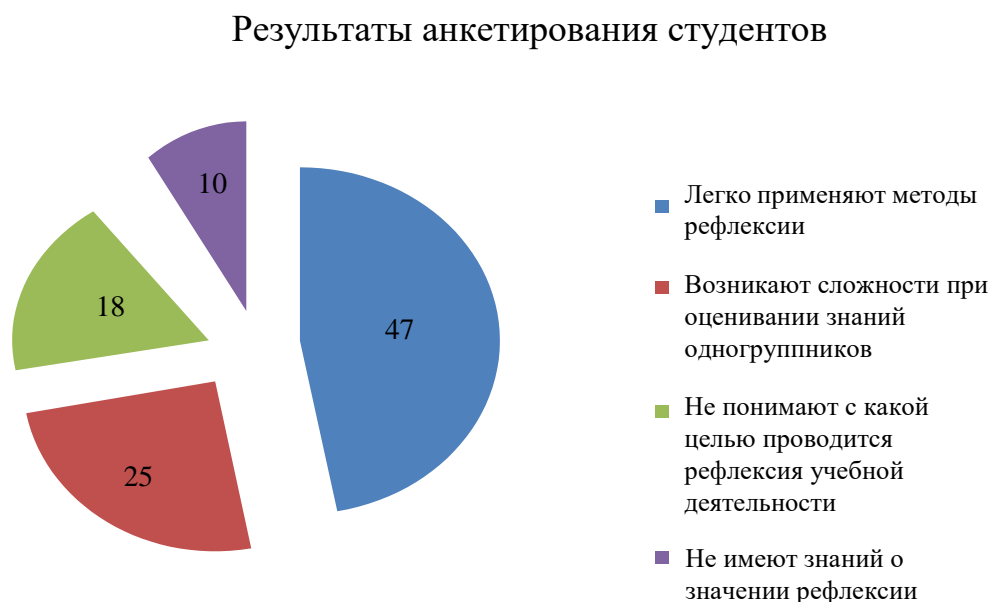
Рис. 2 – Развитость рефлексивных умений студентов и правильного оценивания собственной учебной деятельности

Далее исследовалась развитость рефлексивных умений студентов и правильного оценивания собственной учебной деятельности (Приложение 2). Всего было опрошено 28 студентов.