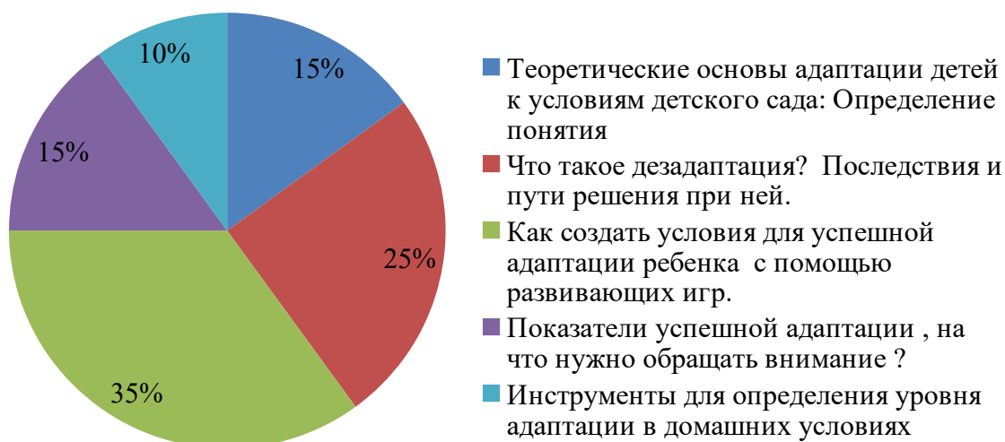
Рисунок № 1 – Результаты анкетирования родителей на тему адаптации ребенка к условиям дошкольной образовательной организации

Таким образом, из результатов мы видим, что большая часть родителей интересуется вопросом успешной адаптации ребенка к условиям детского сада с помощью игр. Помимо этого, мы видим, что 2 по значимости вопросом, в котором заинтересованы родители, является процесс дезадаптации. Так же родители задавали вопросы об значении режима дня в сохранении эмоционального благополучия ребенка и создание условий для развития сенсорных способностей детей. Таким образом была разработана тематическая работа «Школы родителей» (Таблица № 6).