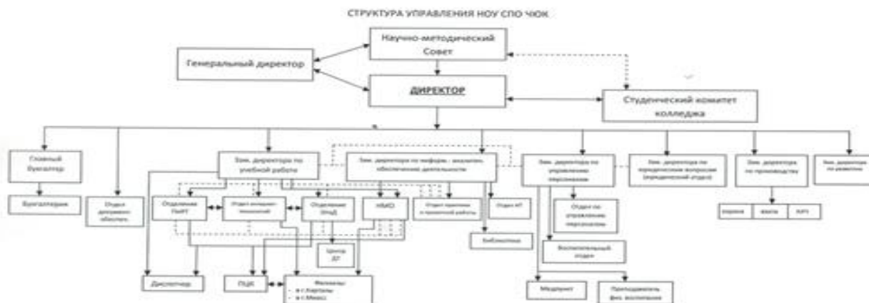
Рисунок 1. Организационная структура ПОУ «Челябинский юридический колледж»

Из рисунка 1 видно, что организационная структура носит иерархичный характер. Широкий спектр учебной, научной и воспитательной деятельности объясняет наличие шести заместителей директора колледжа.