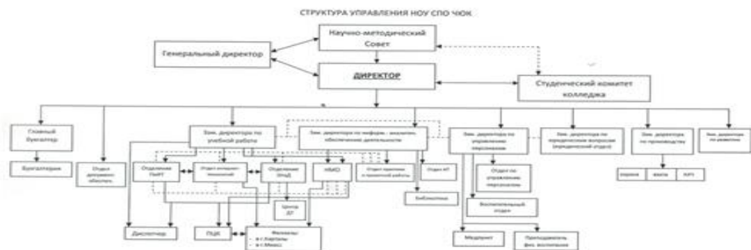
Рисунок 1. Организационная структура ПОУ «Челябинский юридический колледж»

Из рисунка 1 видно, что организационная структура носит линейный характер. Широкий спектр учебной, научной и воспитательной деятельности объясняет наличие шести заместителей директора колледжа. Разветвленная организационная структура так же объясняется тем, что было объединение двух учебных заведений с имущественным комплексом: учебные корпуса, общежития, спортивные залы и производственные мастерские.