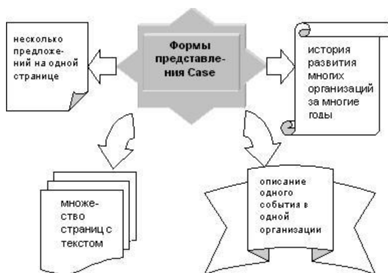
Рисунок 1. Формы представления Кейса

Он может, включать известные академические модели или не соответствовать ни одной из них.