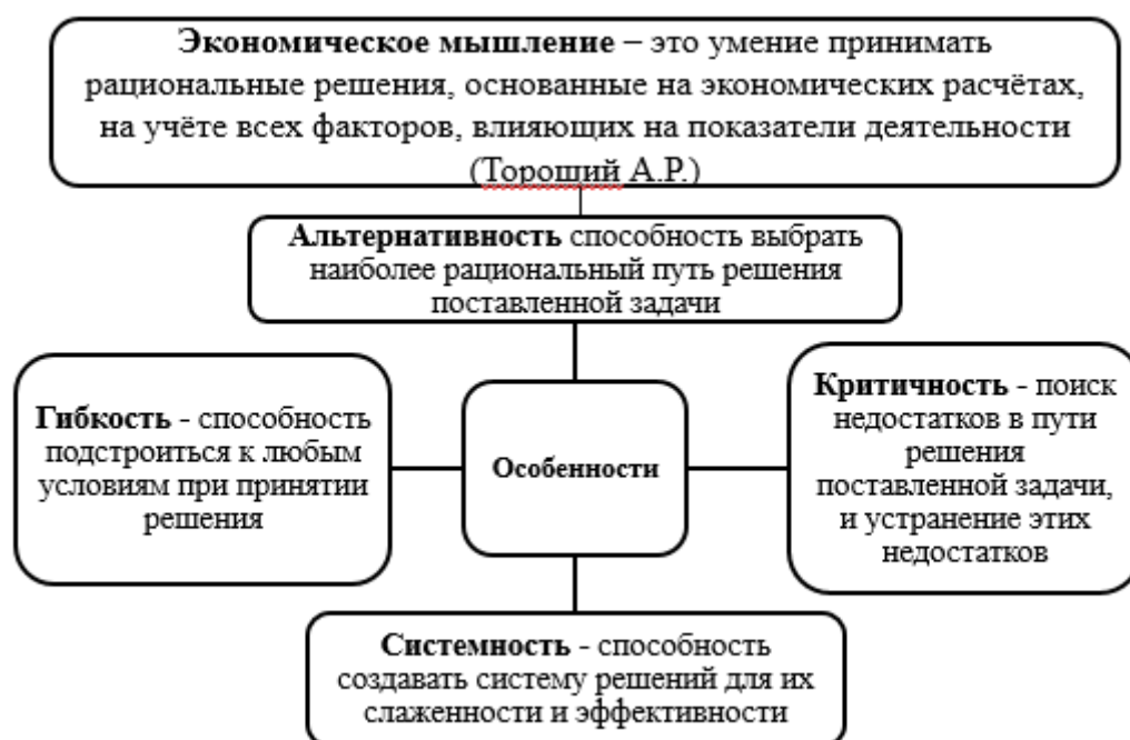
Рис. 2 – Основные особенности современного экономического мышления

Схематически представим вышеизложенное на рисунке 2.