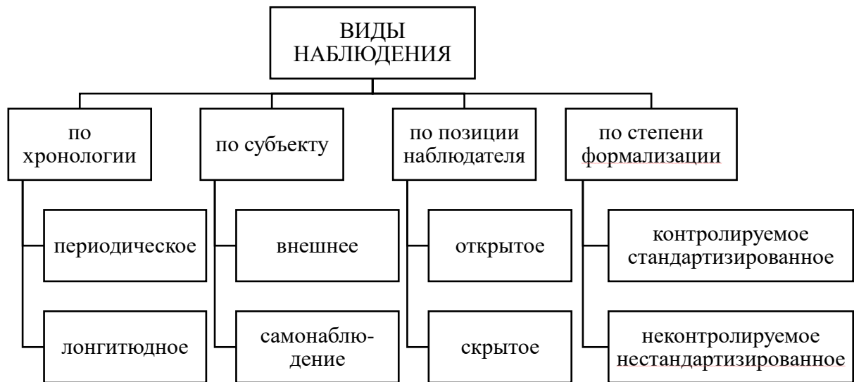
Рис. 2. Виды наблюдения