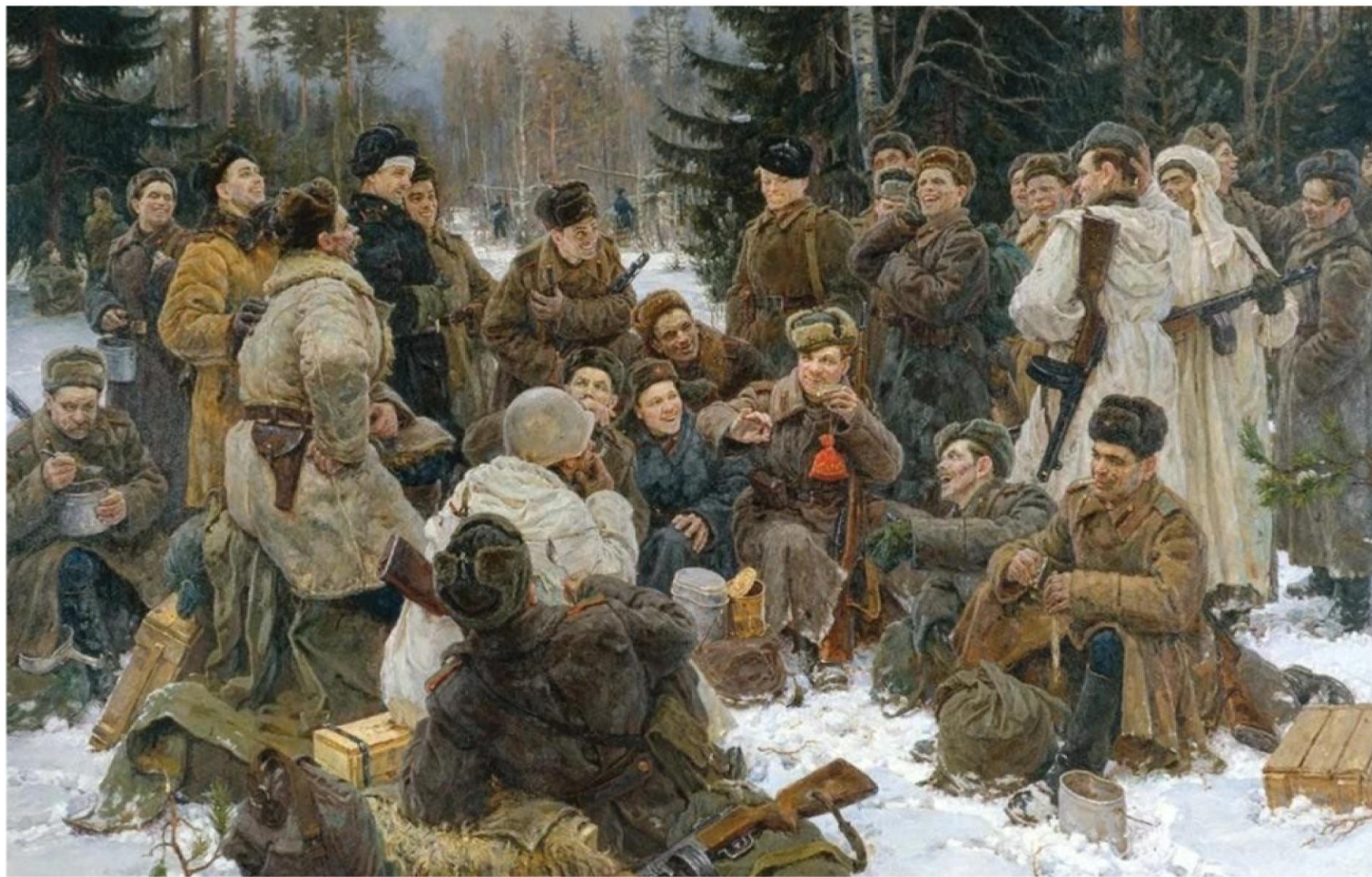
Репродукция картины художника Ю. М. Непринцева «Отдых после боя» (1951 г.)