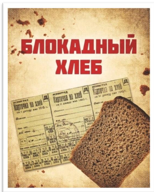
125 г. блокадного хлеба...