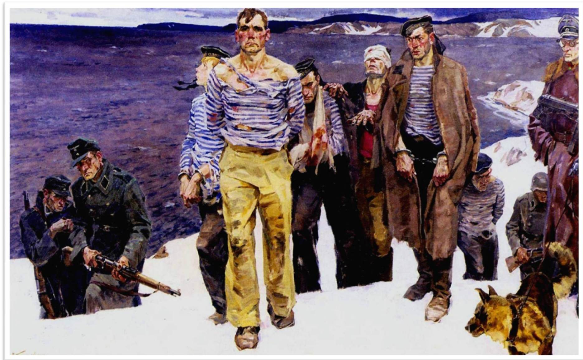
Репродукция картины художника В. Г. Пузырькова «Непокорённые» (1946 г.)