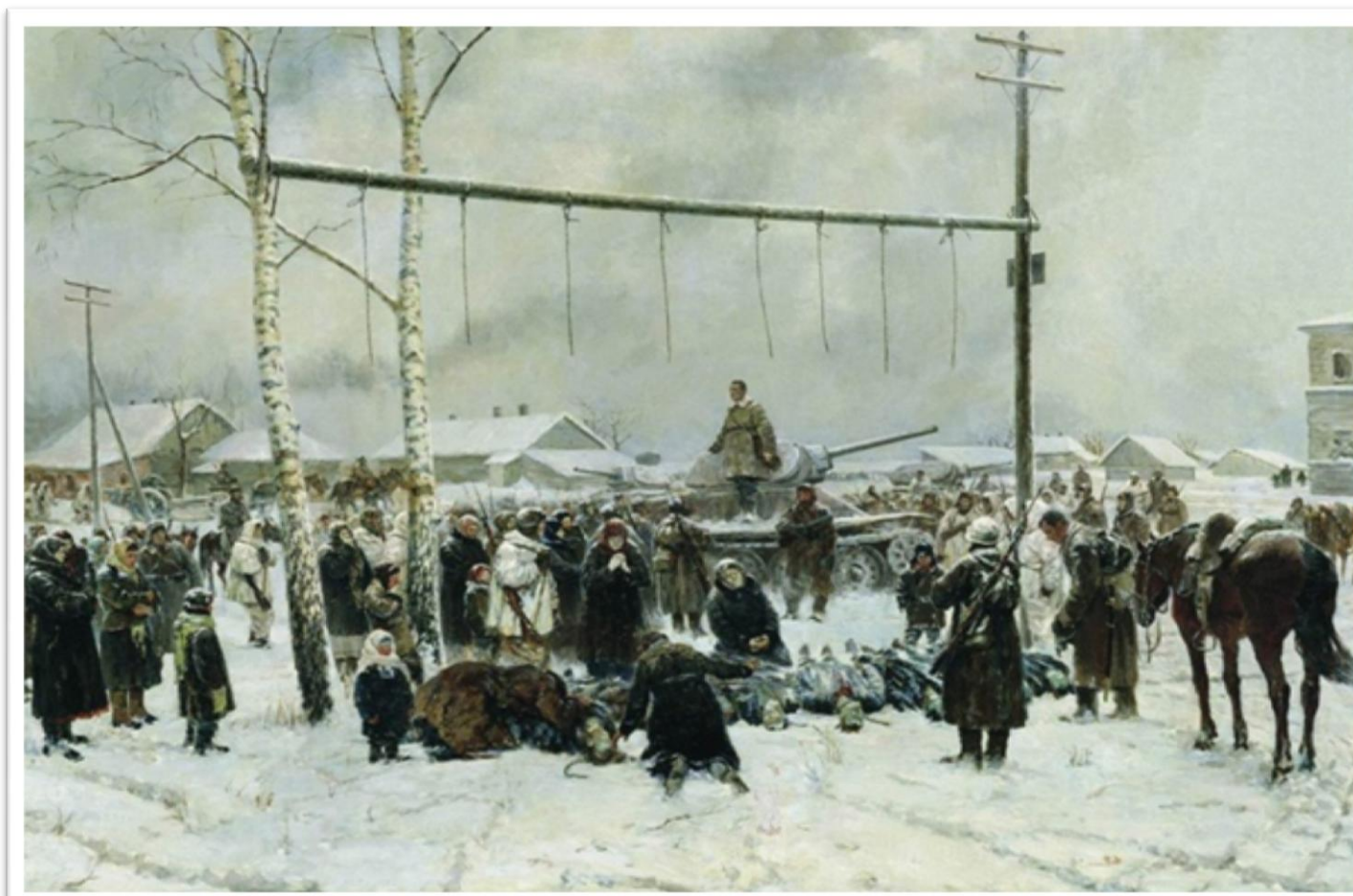
Репродукция картины художника П. А. Кривоногова «Не забудем, не простим» (1943 г.)

приготовился к атаке солдат с забинтованной головой. Над крепостью ещё развевается красный флаг. В дыму и пламени сражения трудно отличить живых от мёртвых. В бой идут все, не считаясь с ранами. Все сражаются, все бьются за Брест, за Родину!