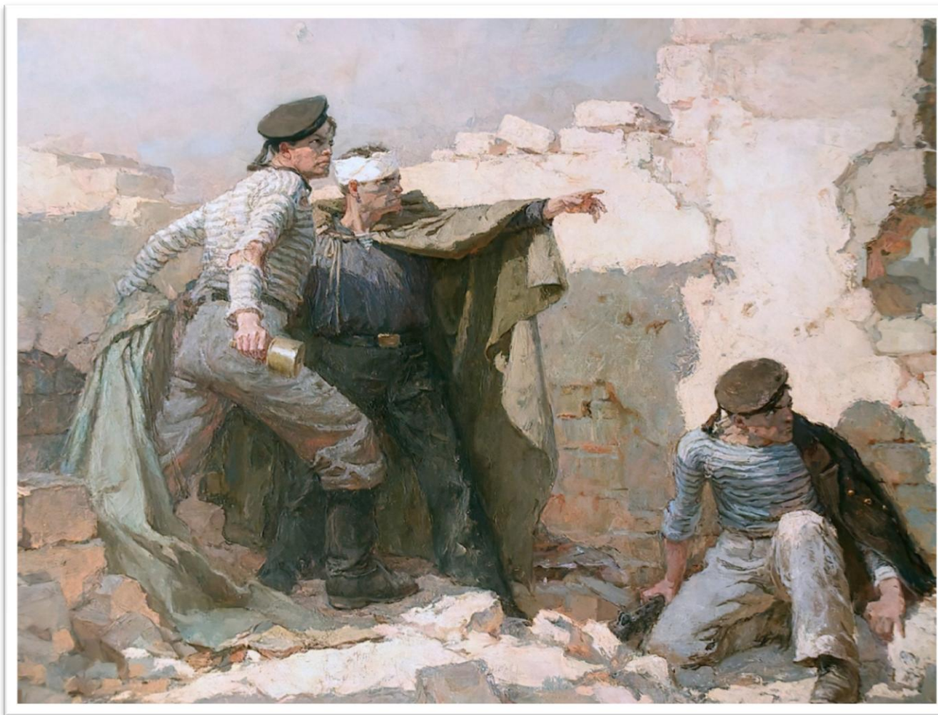
Репродукция картины художника Ю. М. Непринцева «Последняя граната» (1948 г.)

Произведение относится к послевоенным работам художника и посвящено героической борьбе советского народа против фашистской Германии.