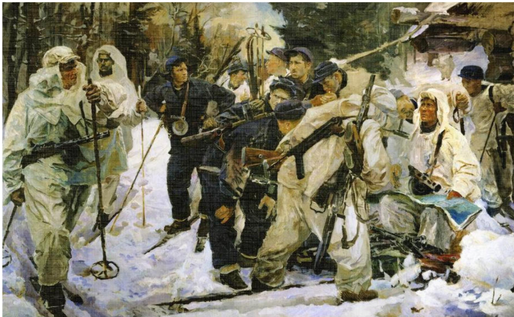
Репродукция картины художника И. А. Серебряного «Партизаны-лесгафтовцы. После боевой операции» (1942 г.)