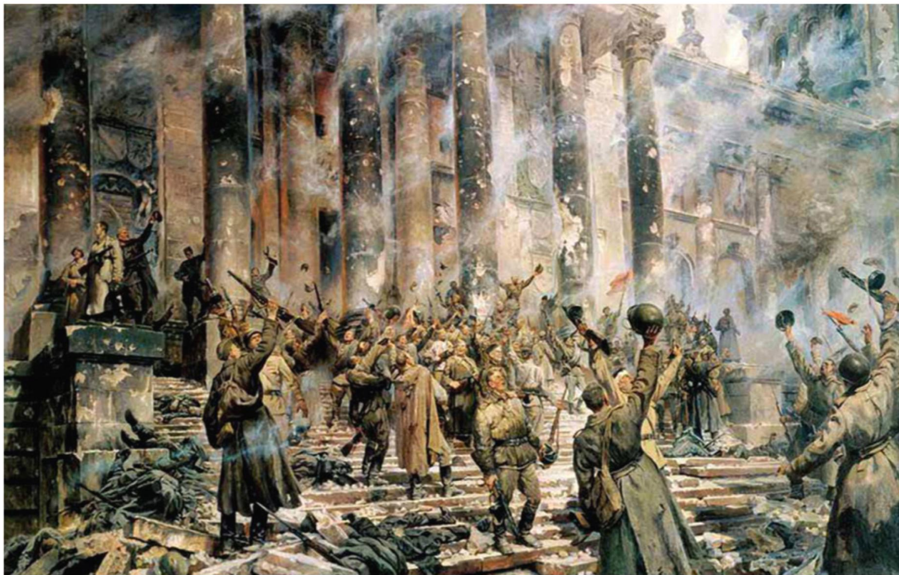
Репродукция картины художника П. А. Кривоногова «Победа» (1948 г.)