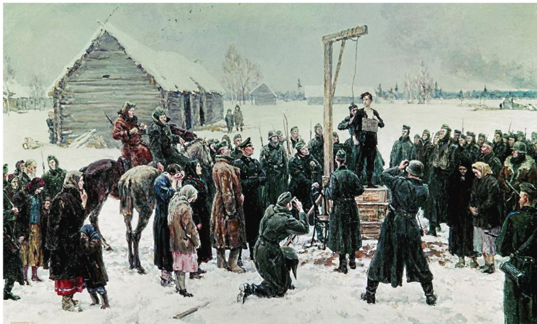
Репродукция картины художников-кукрынников М. Куприянова, П. Крылова, Н. Соколова «Таня» (1942-1947 гг.)