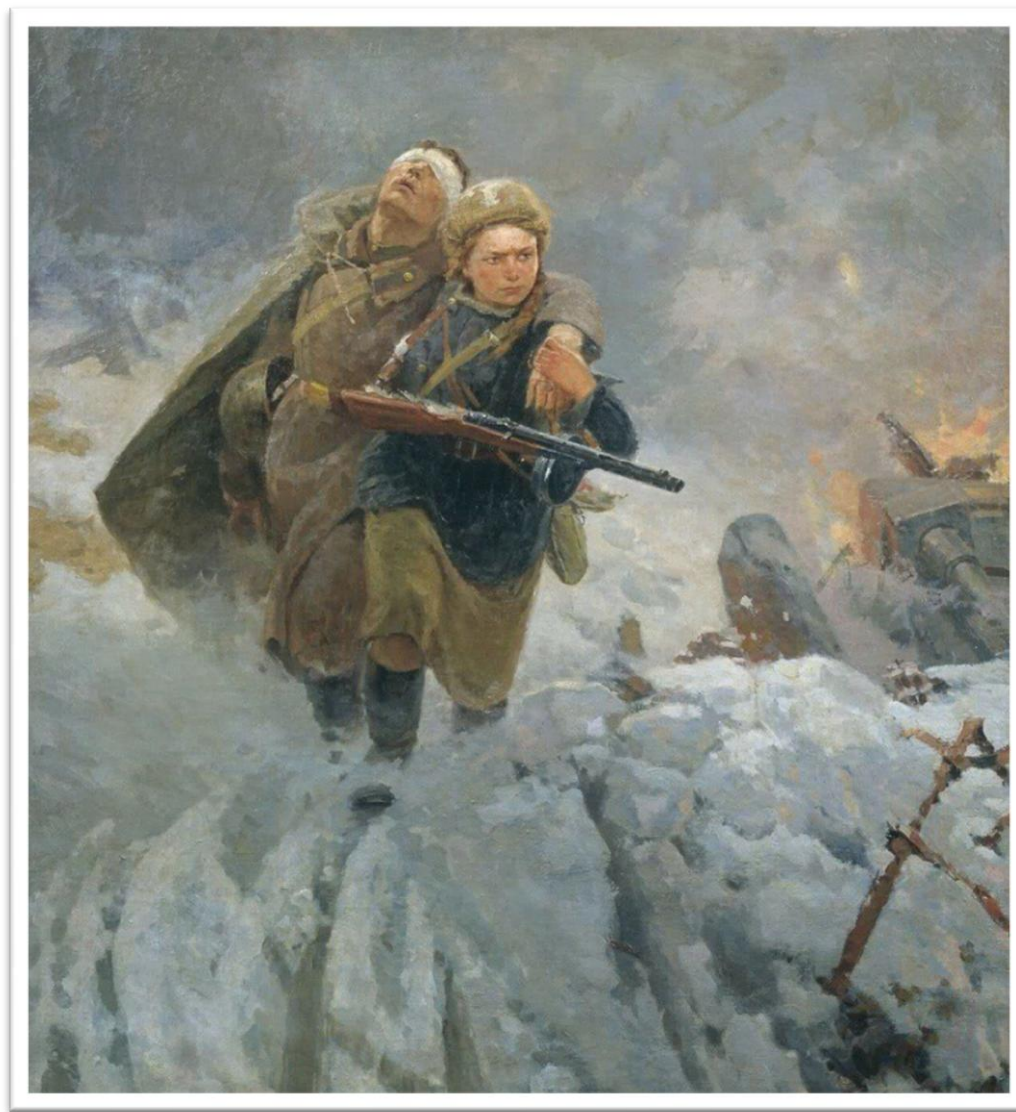
Репродукция картины художника М. И. Самсонова «Сестрица» (1954 г.)