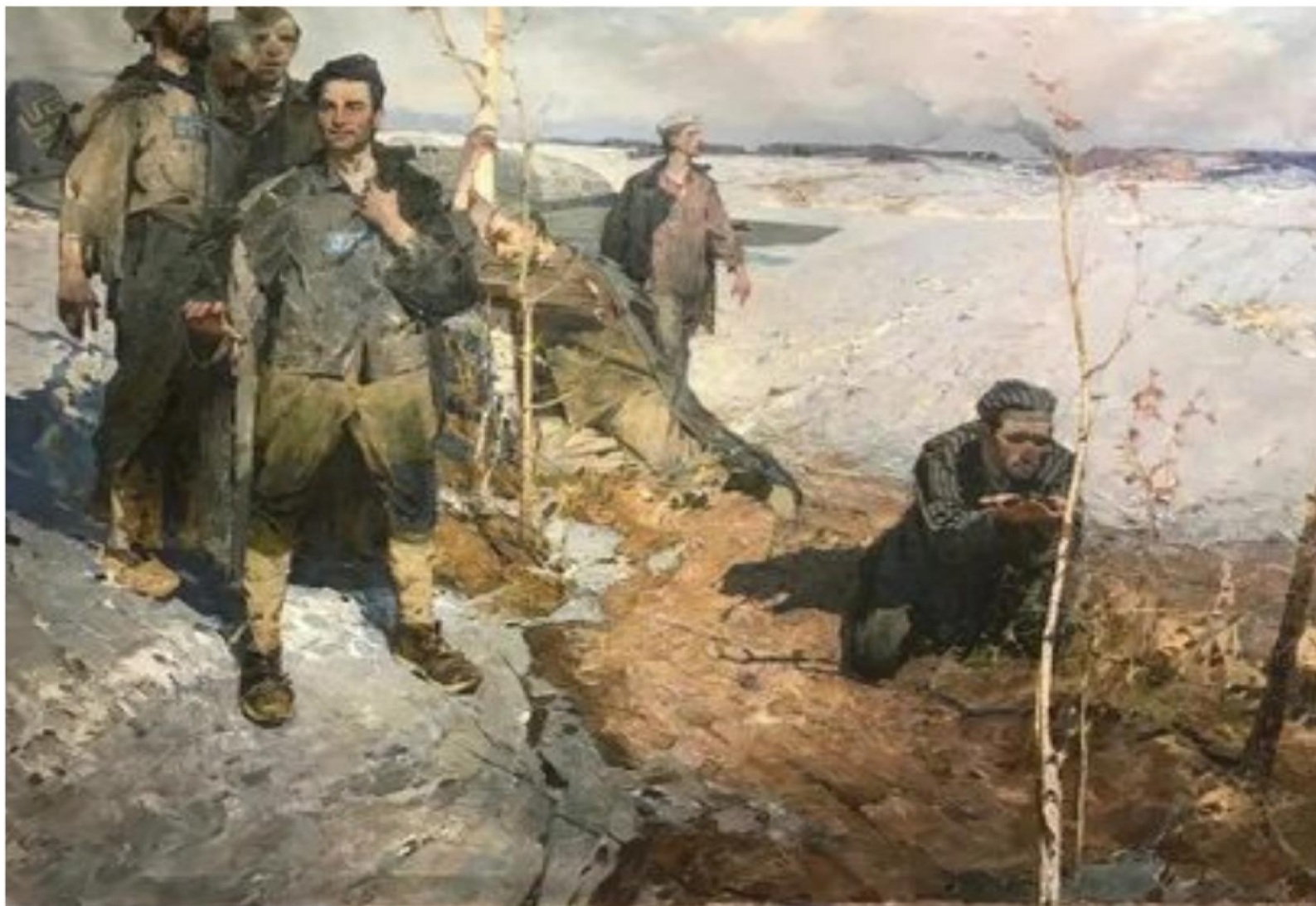
Репродукция картины художника А. П. Бурлай «Земля родная (Подвиг лётчика М. Девятаева)» (1961 г.)