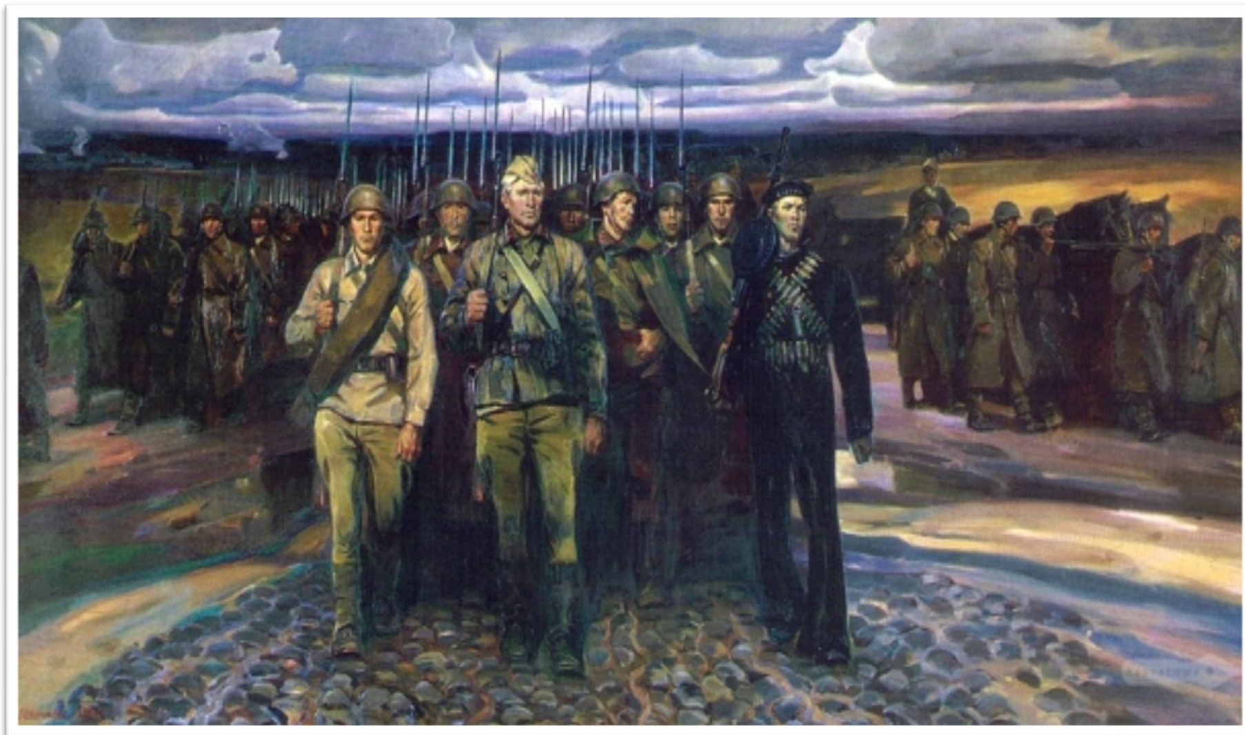
Репродукция картины художника В. В. Шаталина «Вставай, страна огромная!» (1985 г.)