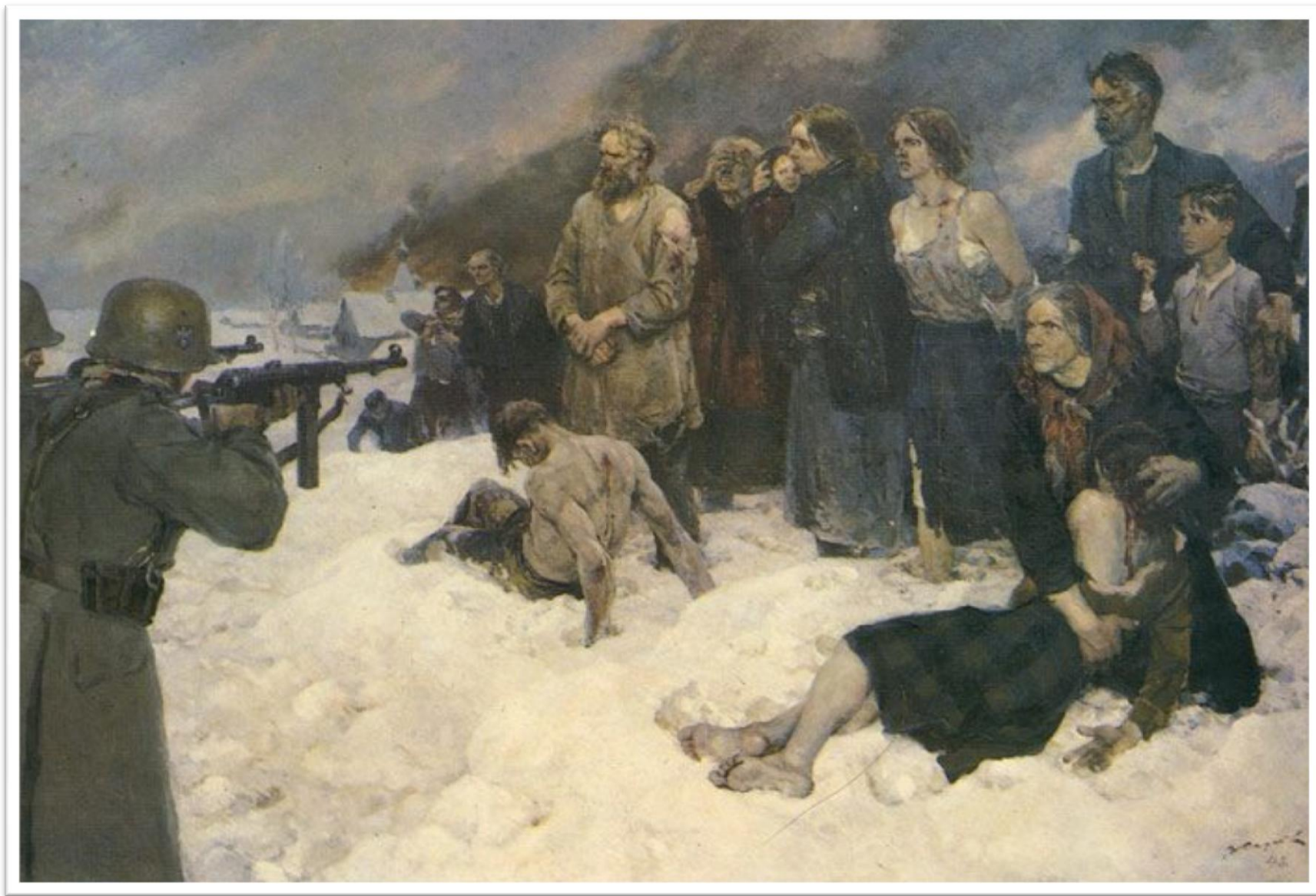
Репродукция картины художника В. А. Серова «Кратели»