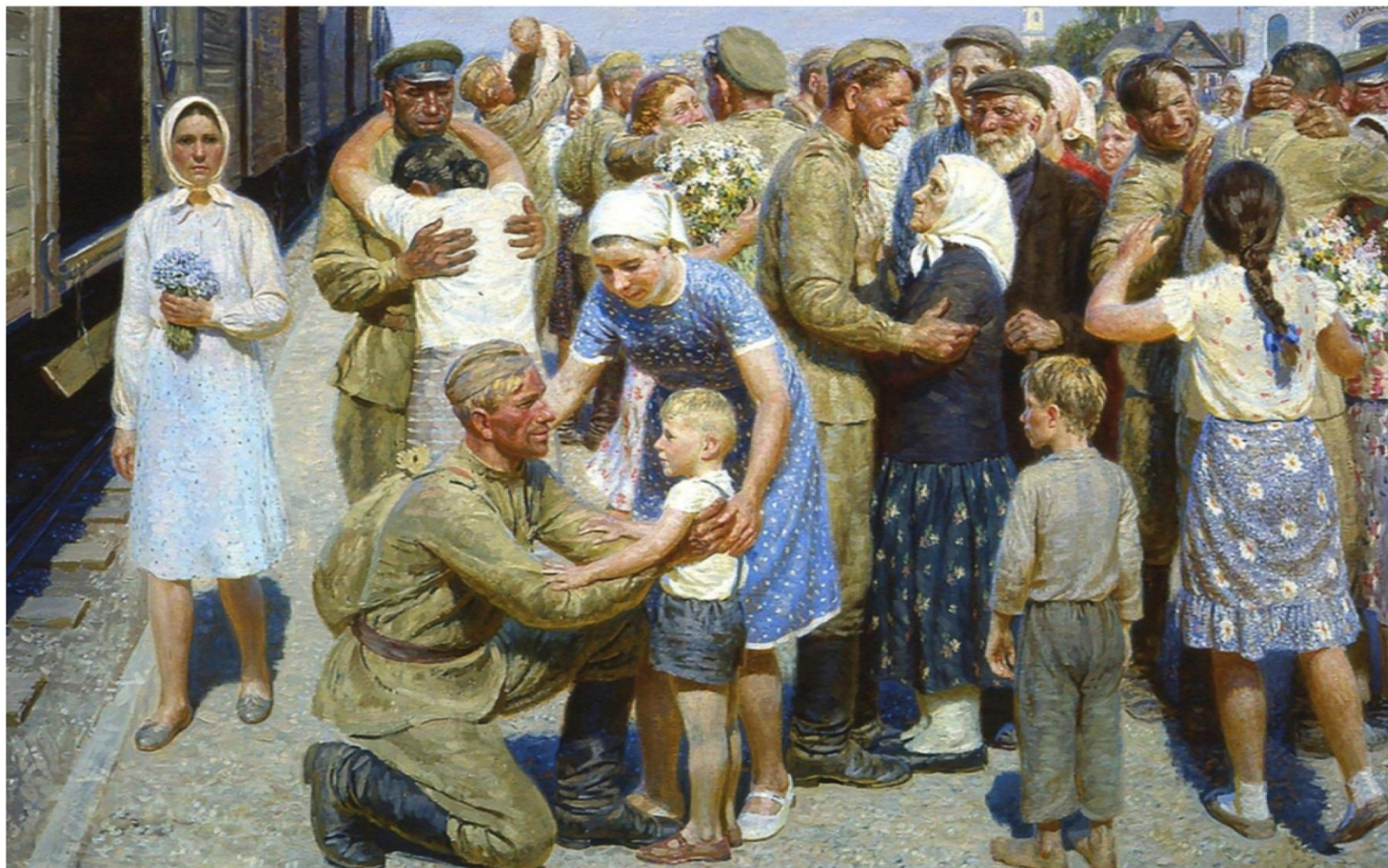
Репродукция картины художника Ю. П. Кугач «После Победы» (1980 г.)