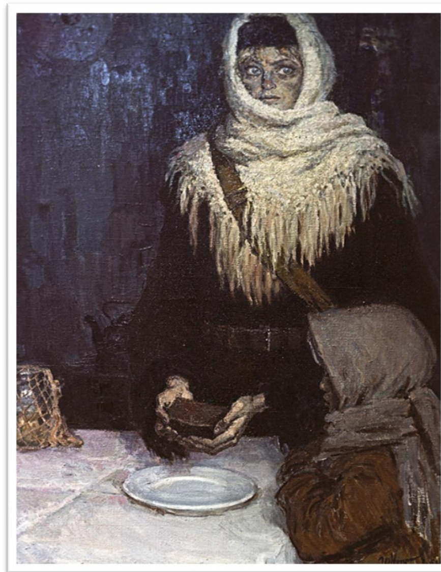
Репродукция картины художника Ю. Непринцева «Хлеб» (1964 г.)