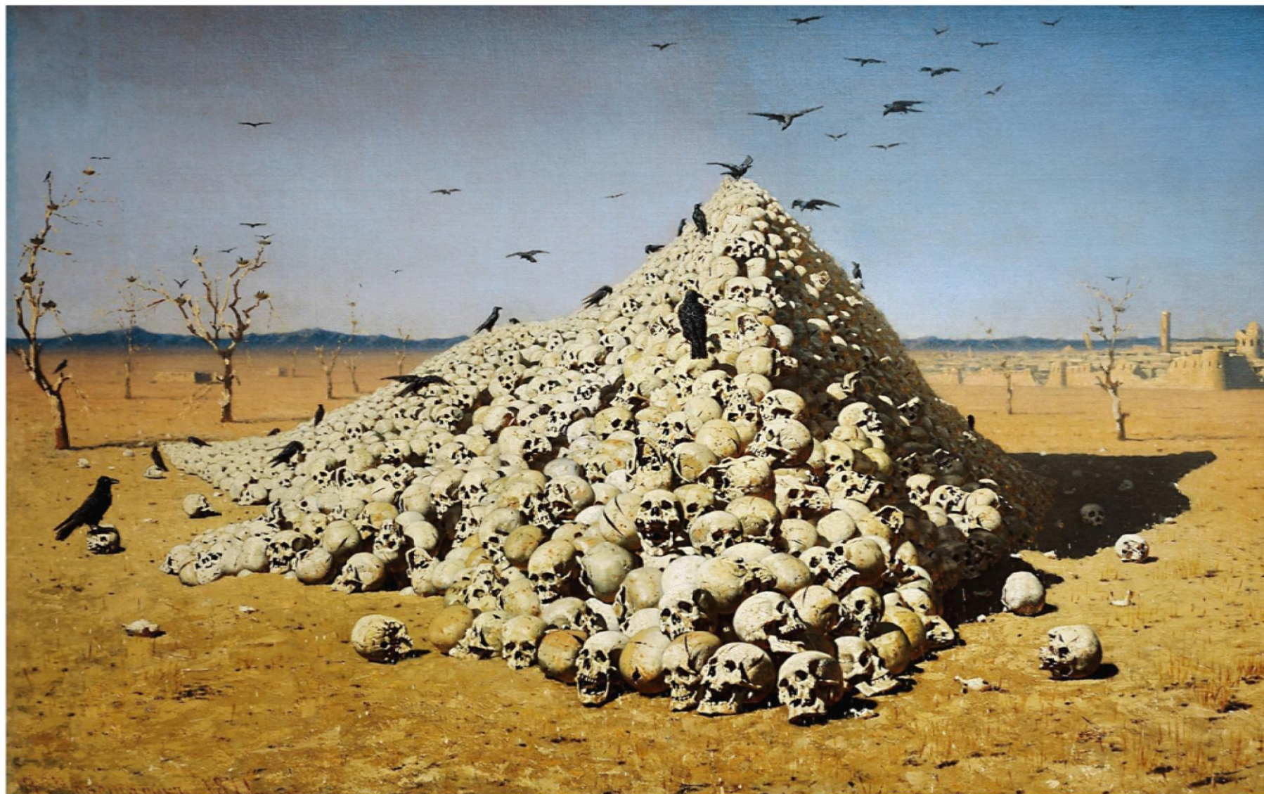
Репродукция картины художника В. В. Верещагина «Апофеоз войны» (1871 г.)