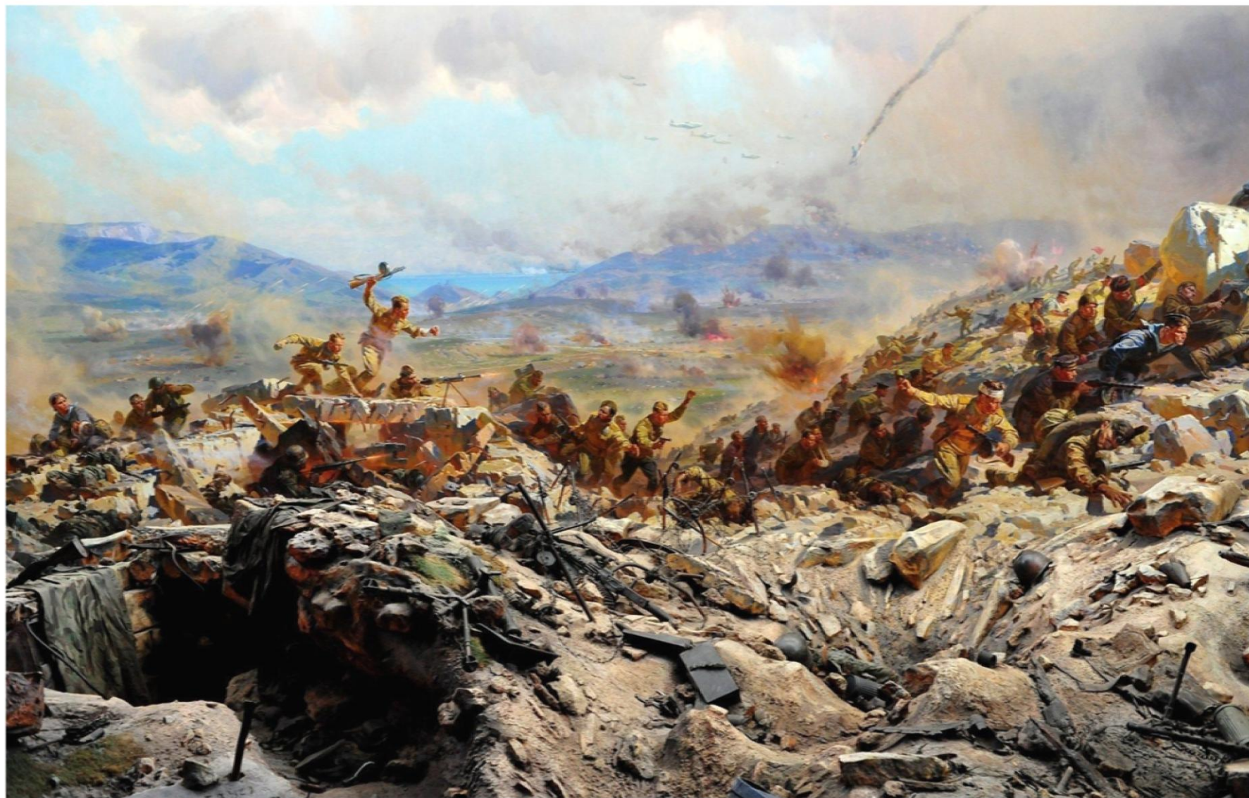
Репродукция картины художника П. Т. Мальцева «Штурм Сапун-горы» (1954 г.)