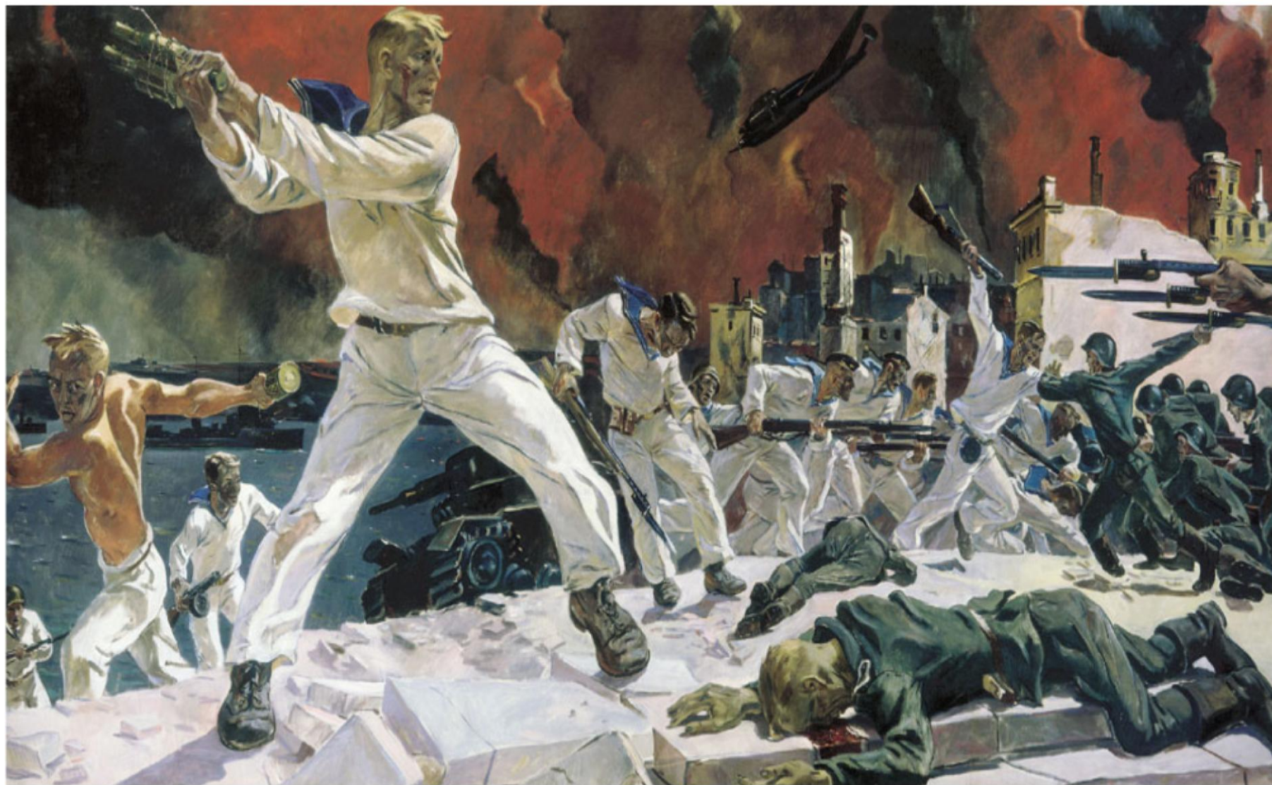
Репродукция картины художника А. А. Дейнека «Оборона Севастополя» (1942 г.)