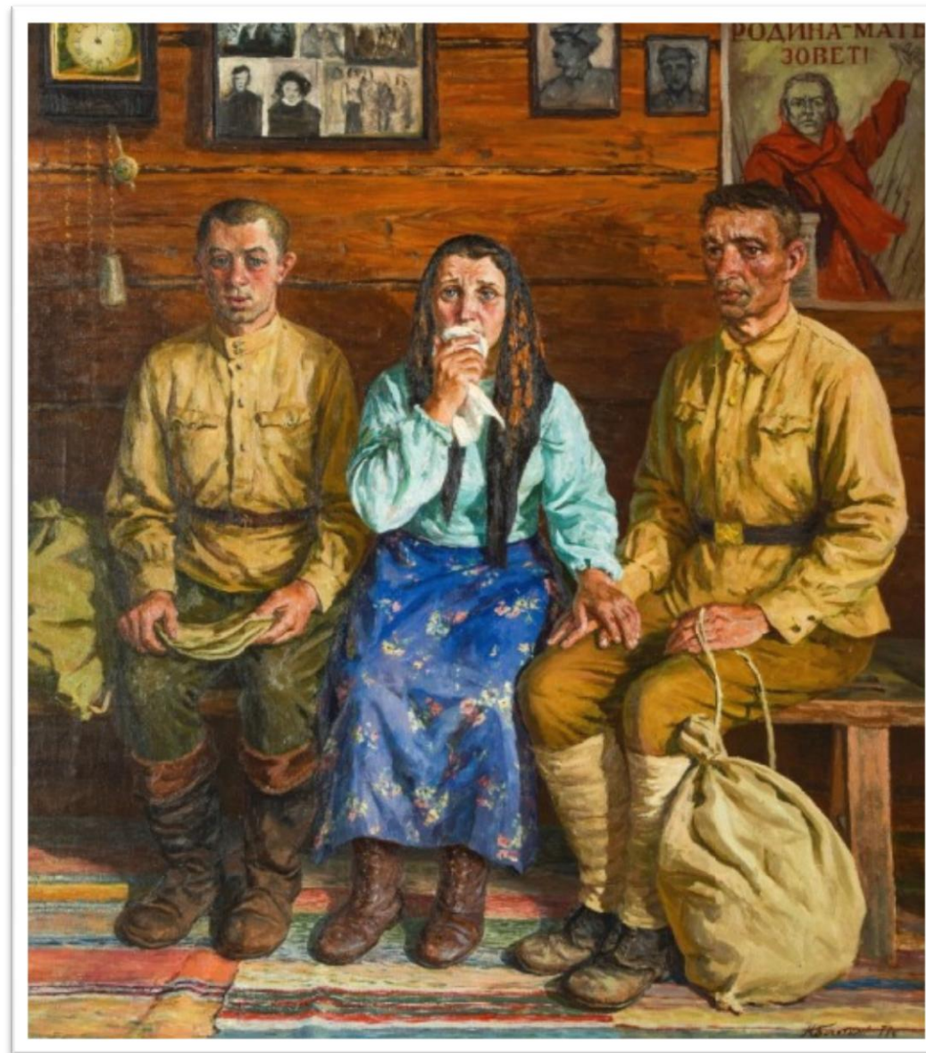
Репродукция картины художника М. Г. Богатырёва «Проводы» (1977 г.)