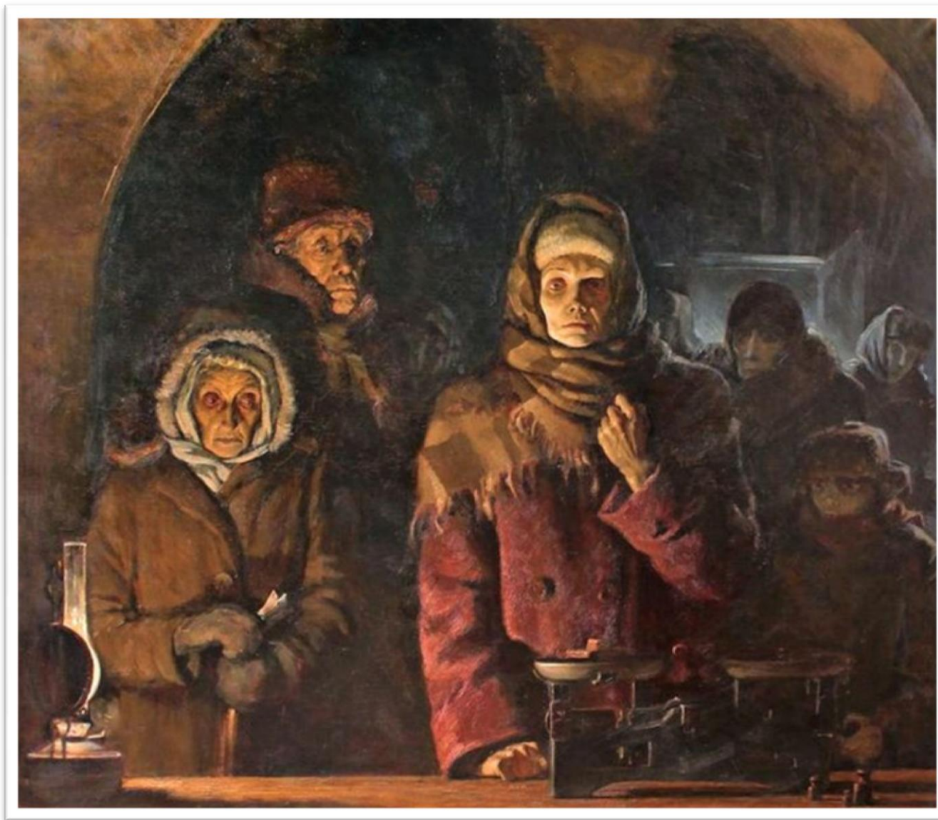
Репродукция картины художника Н. В. Цыцина «Блокадный хлеб» (1987 г.)