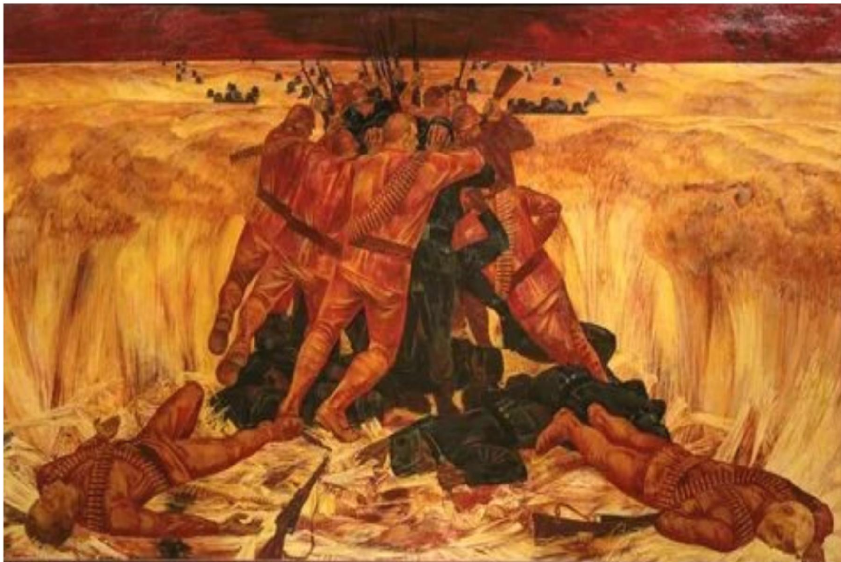
Репродукция картины художника М. А. Савицкого «Поле» (1973 г.)