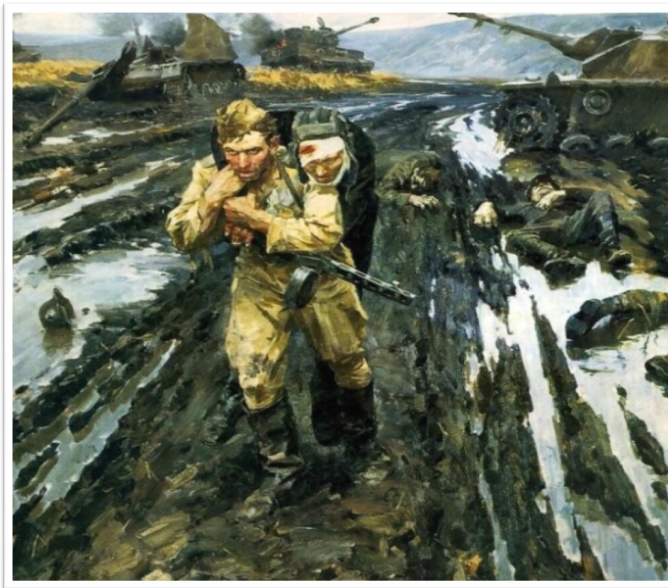
Репродукция картины художника В. Г. Пузырькова «Солдаты» («Побратимы») 1972 г.