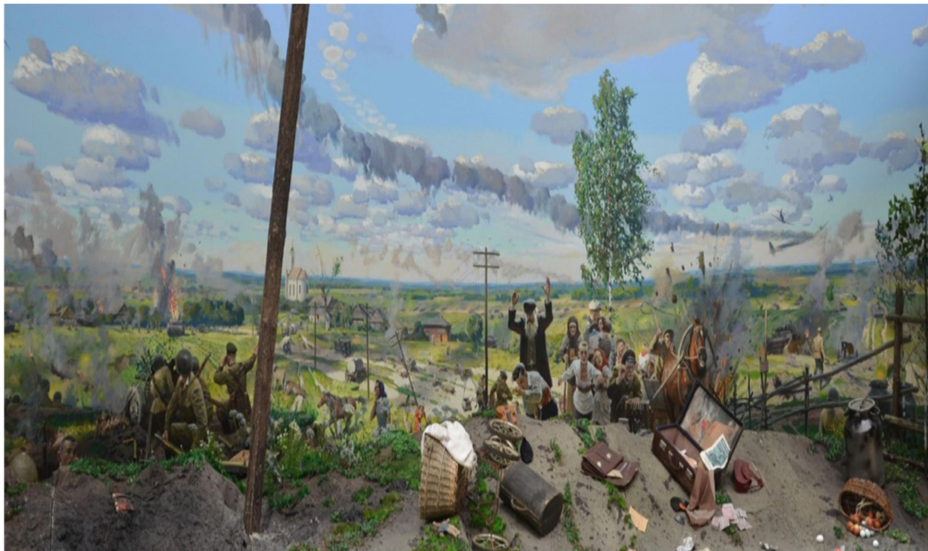
Репродукция картины художника П. В. Рыженко «Начало войны 1941 года» (2011 г.)