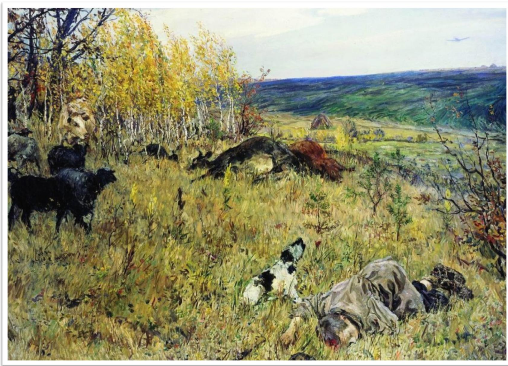
Репродукция картины художника А. А. Пластова «Фашист пролетел» (1942 г.)