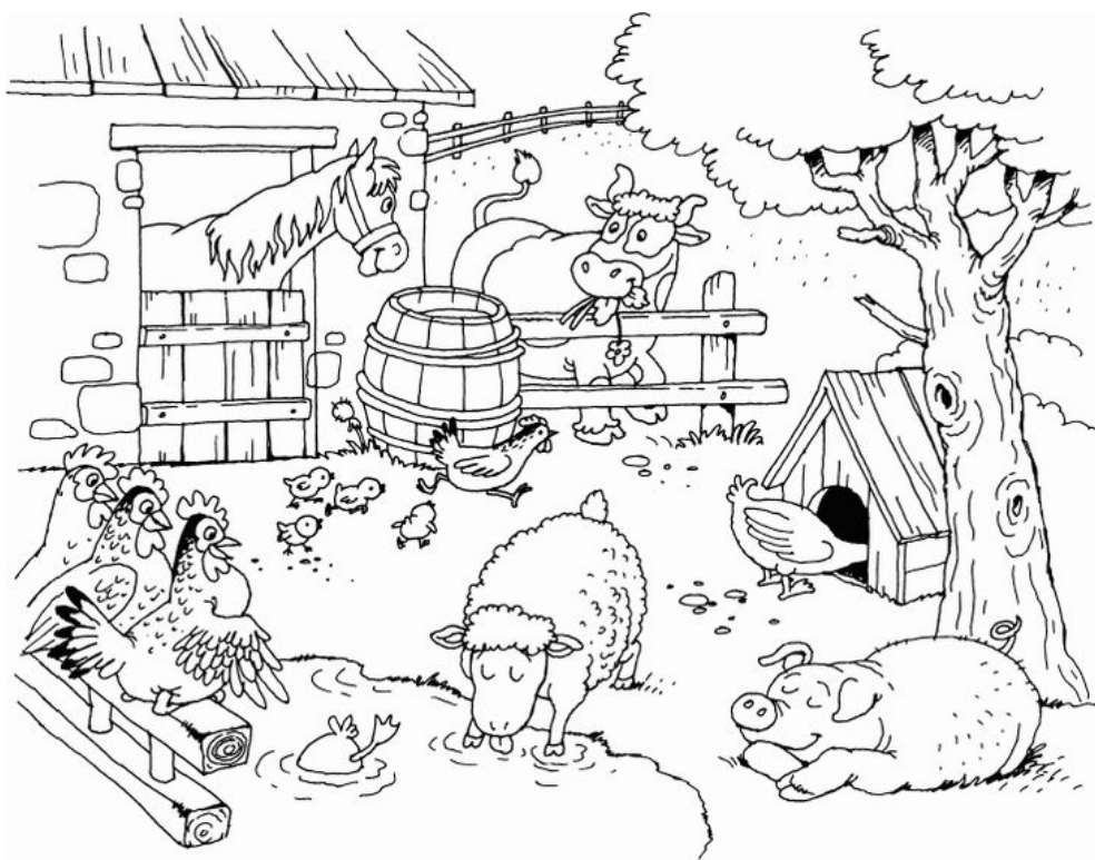
Рисунок 3 – Картинки – сюжеты