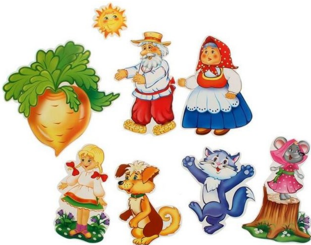
Рисунок 2 – Картинки для вырезания