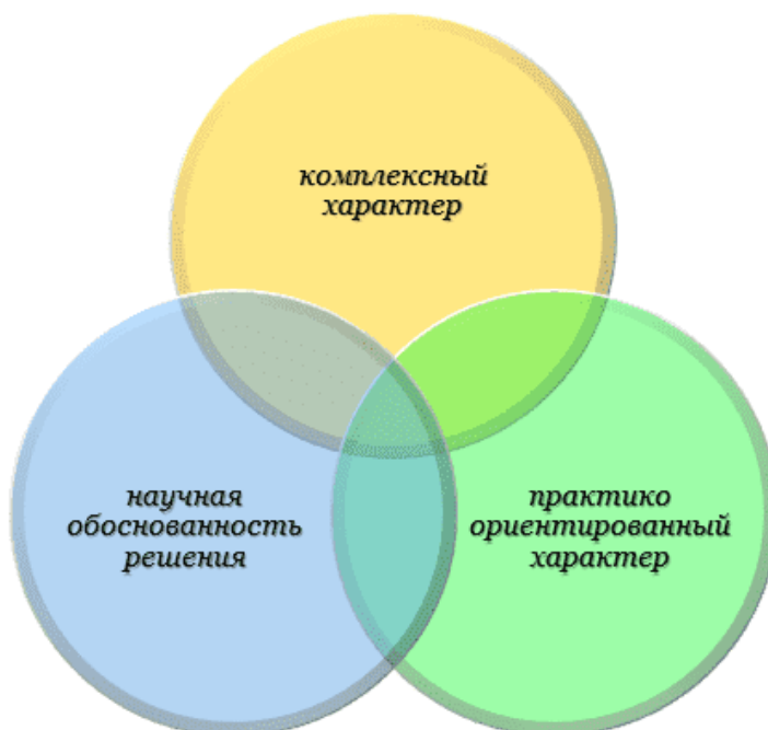
Рисунок 4 – Степени выявления ситуационных заданий

Ключевая цель ситуационного обучения заключается в скрупулезном воспроизведении реальных образовательных ситуаций. Ситуационная задача формирует практико-ориентированную модель педагогической ситуации, способствующую закреплению теоретических знаний, развитию практических умений и формированию навыков принятия решений у обучающихся.