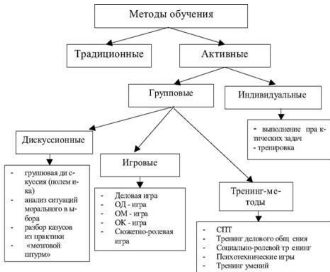
Рисунок 1 – Методы обучения.

Профессор А.А. Вербицкий выделяет ключевые недостатки современной системы активного обучения: