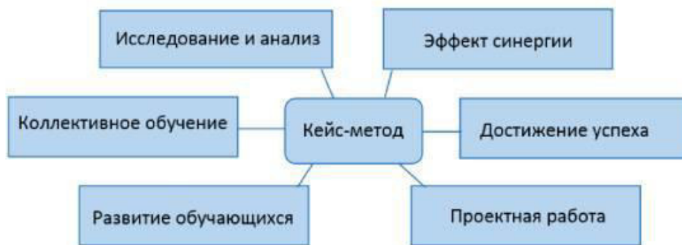
Рисунок 3 – Кейс-методы.

Кейс-метод представляет собой инновационный подход к организации обучения, основанный на анализе конкретных жизненных ситуаций. Его суть заключается в том, что студентам предлагается осмыслить реальную проблему, требующую применения теоретических знаний для её решения. Важная особенность метода – отсутствие единственно верного решения, что стимулирует творческое мышление и самостоятельность.