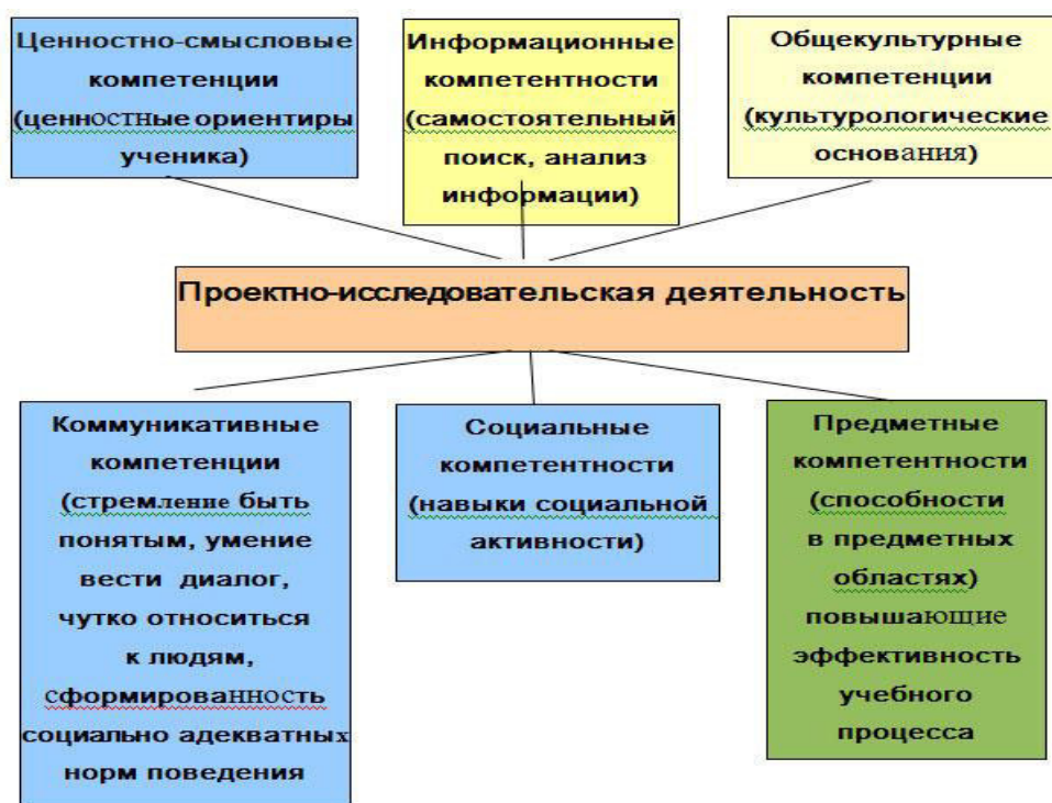
Рисунок 2 – Проектно-исследовательская деятельность.

Проектная деятельность выступает эффективным методом вовлечения студентов в процессы проектирования, конструирования, моделирования и исследования. Проект становится значимой самостоятельной составляющей подготовки конкурентоспособного специалиста, направленной на: