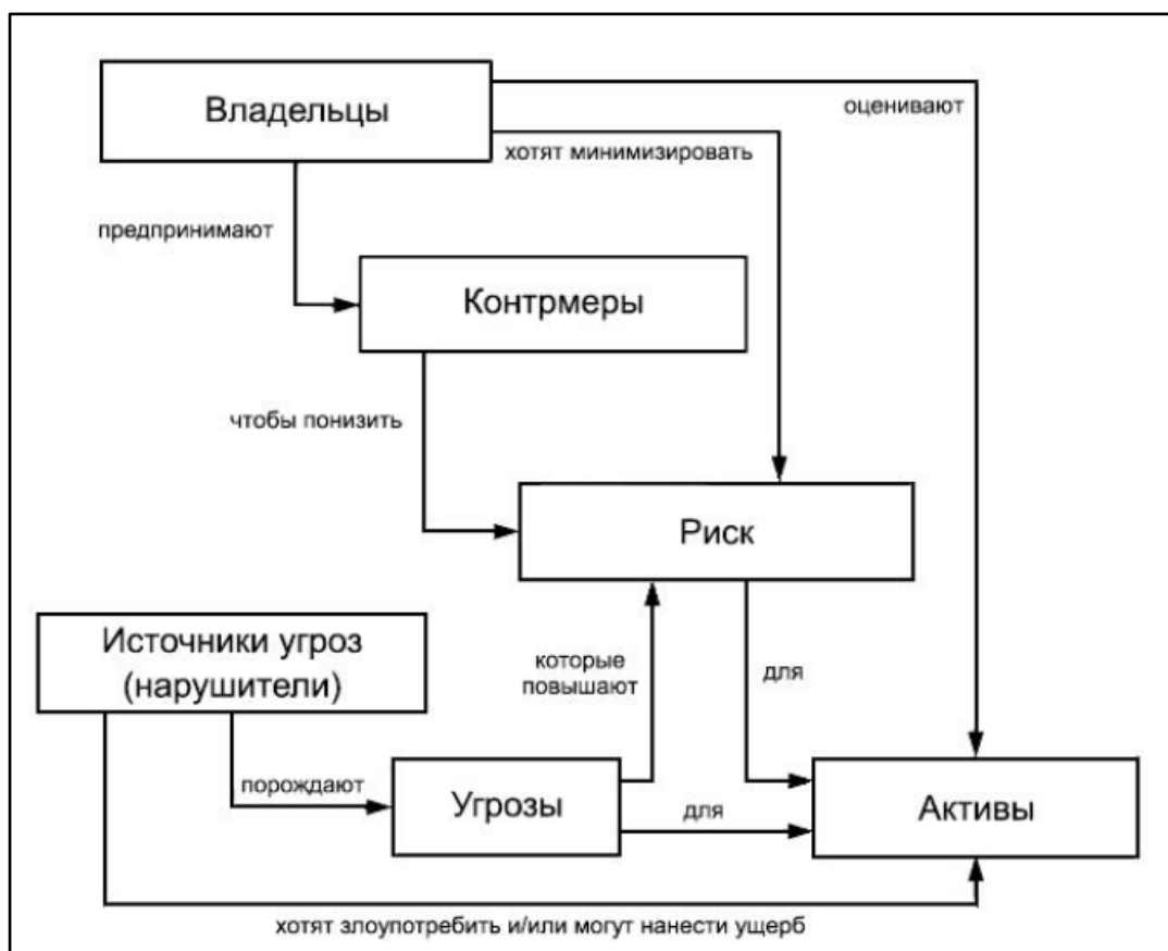
Рис. 5. Понятия безопасности и их взаимосвязь [12]

Цель ПИБ: создание условий (организационных, технических, информационных) для реализации требований законов РК, государственных стандартов в области информационной безопасности, постановлений правительства РК.