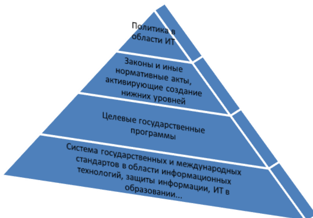
Рис. 1. Структура системы обеспечения развития ИКТ в государстве и в отдельных отраслях (образование)

Учет конкурентных преимуществ, которые обеспечивают современные ИКТ на уровне отдельных организаций и всего государства в целом, а также риски и угрозы, возникающие для информационных инфраструктур разного уровня, привел к пониманию о системном подходе к защите информации. В РФ последовательно проводится политика на создание действенных механизмов в области законодательства, информационно-технического обеспечения, повышения уровня грамотности граждан в области информационной безопасности. Для разрешения имеющихся и перспективных проблемных ситуаций создается система обеспечения национальных интересов в ИКТ-области. Структура такой системы (по имеющимся материалам [10], [38], [47], [51] и др.) может быть представлена в виде иерархии (Рис. 1).