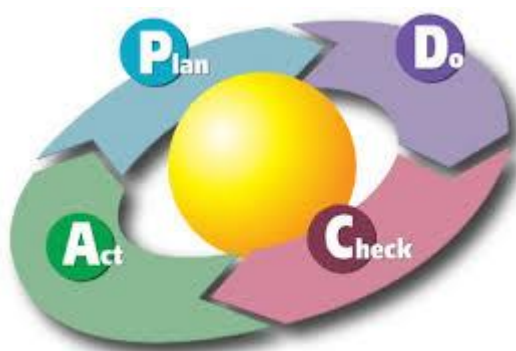
Рис. 3. Классический цикл Шухарта-Деминга

Основой модели эксперимента стал «цикл Шухарта-Деминга», использующийся в стандарте по системам менеджмента качества ISO 9000 [46]. Этот цикл построен на четырех повторяющихся операциях: «Планировать», «Выполнять», «Проверять», «Корректировать». При каждом обороте цикла организация должна выходить на более высокий уровень по заданным показателям (качества продукции/услуг, количества, ассортимента, удовлетворенности потребителей и т.д.). Английский вариант обозначения цикла (Plan – Do – Check – Act) представлен на Рис. 3.